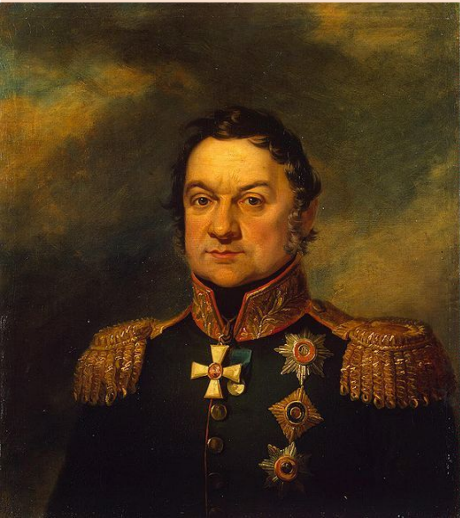
Дмитрий Сергеевич Дохтуров

Атака войск Наполеона, ранение Багратиона, командование принимает «железный» генерал Д. С.Дохтуров. Офицеры приветствуют генерала.