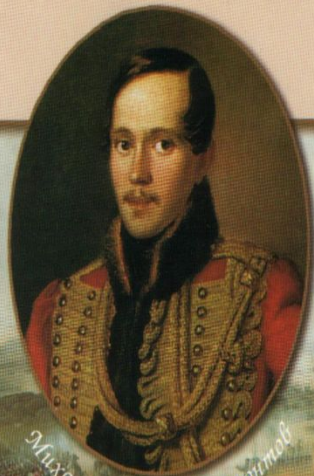
Михаил Юрьевич Лермонтов