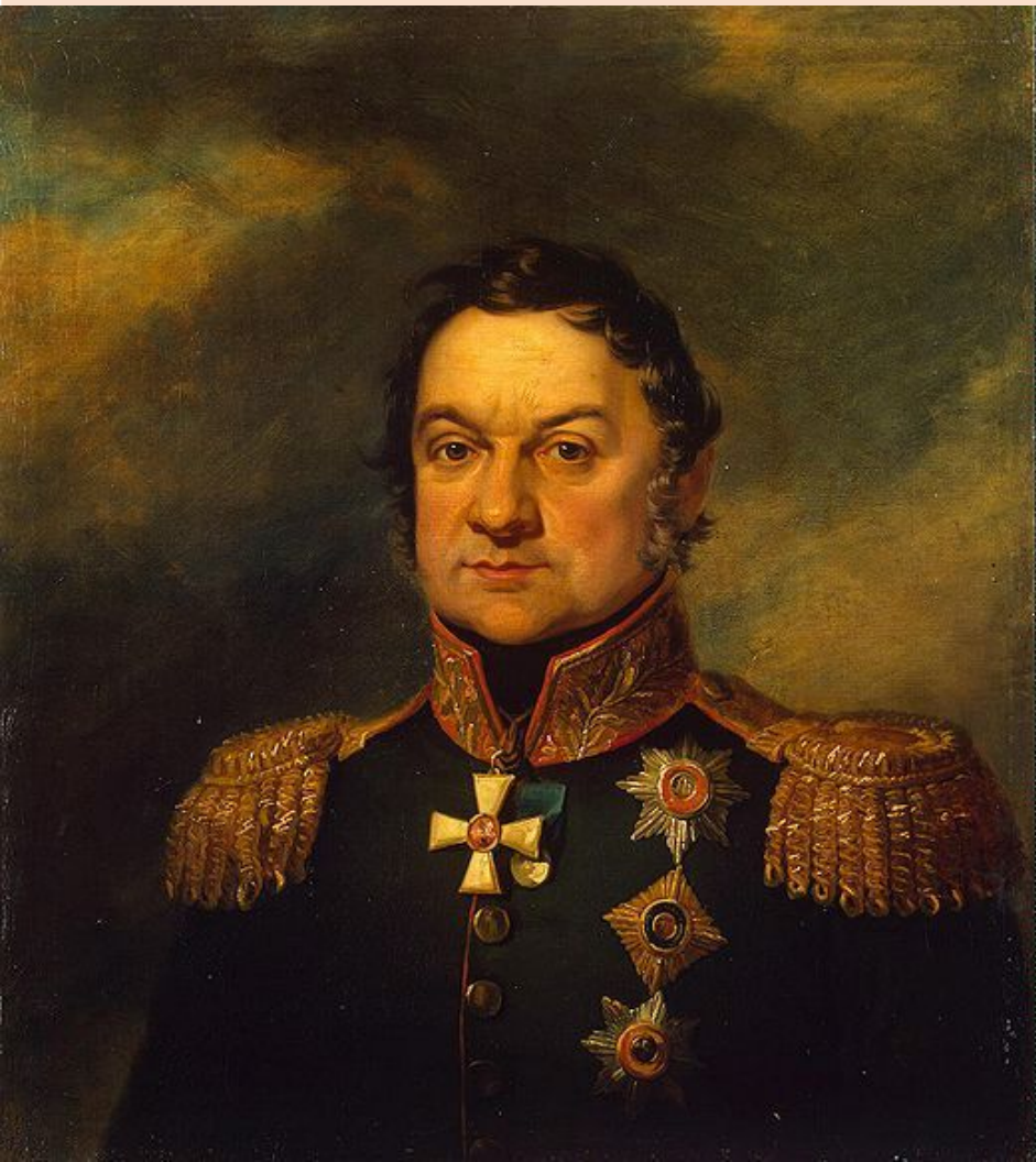
Дмитрий Сергеевич Дохтуров

Атака войск Наполеона, ранение Багратиона, командование принимает «железный» генерал Д. С.Дохтуров. Офицеры приветствуют генерала.