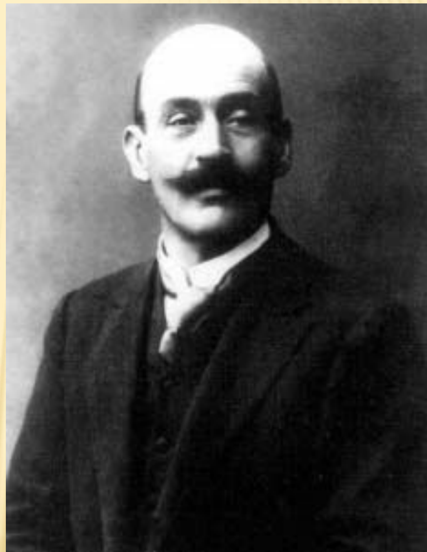
Франц Алексеевич Рубо