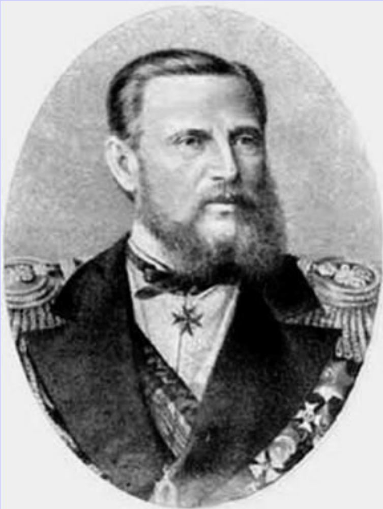
Великий князь Константин Николаевич

Необходимость освобождения осознали и в верхах. За него выступали великие князья Елена Павловна и Константин Николаевич.