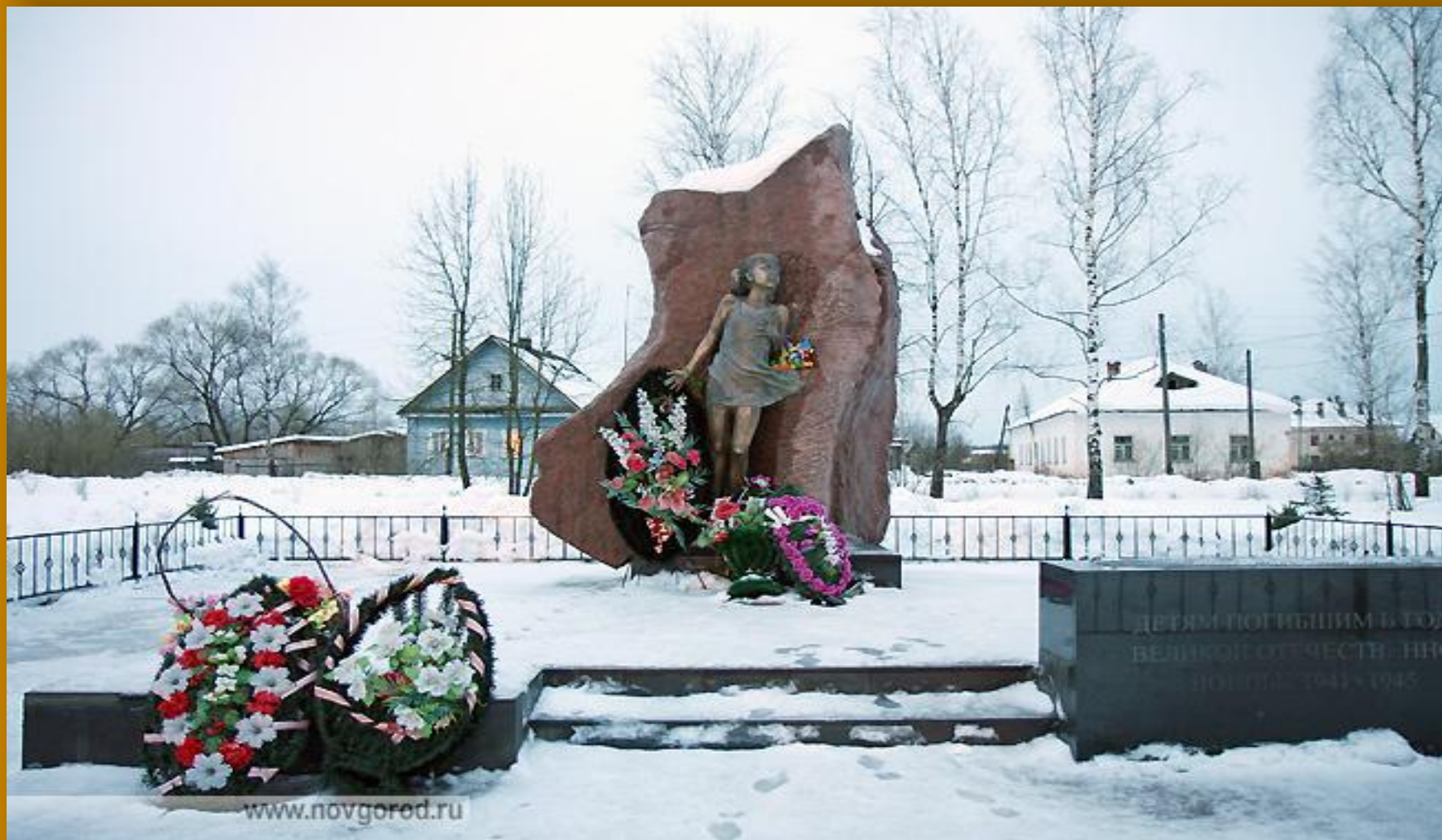
МЕМОРИАЛ «ДЕТЯМ, ПОГИБШИМ В ВЕЛИКОЙ ОТЕЧЕСТВЕННОЙ ВОЙНЕ 1941-1945 ГГ. ПОСЁЛОК ЛЫЧКОВО НОВГОРОДСКОЙ ОБЛАСТИ.