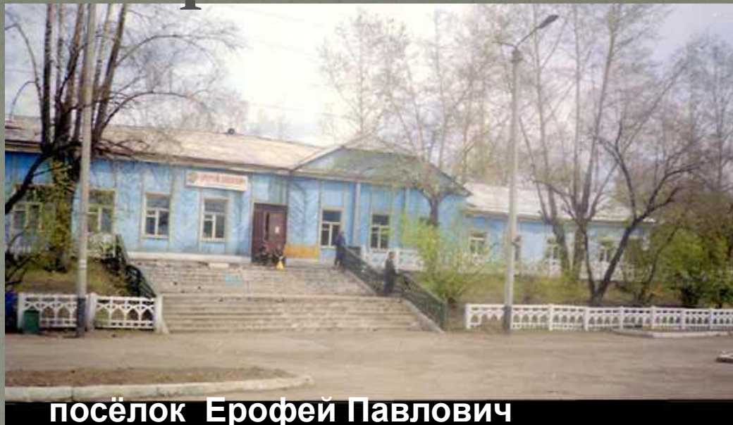
посёлок Ерофей Павлович