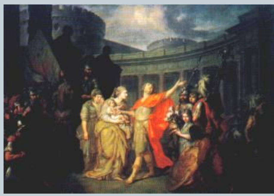
Прощание Гектора с Андромахой

Могучий Гектор, защитник Трои, вернулся ненадолго в свой город, « чтобы увидеть домашних, жену дорогую и сына».