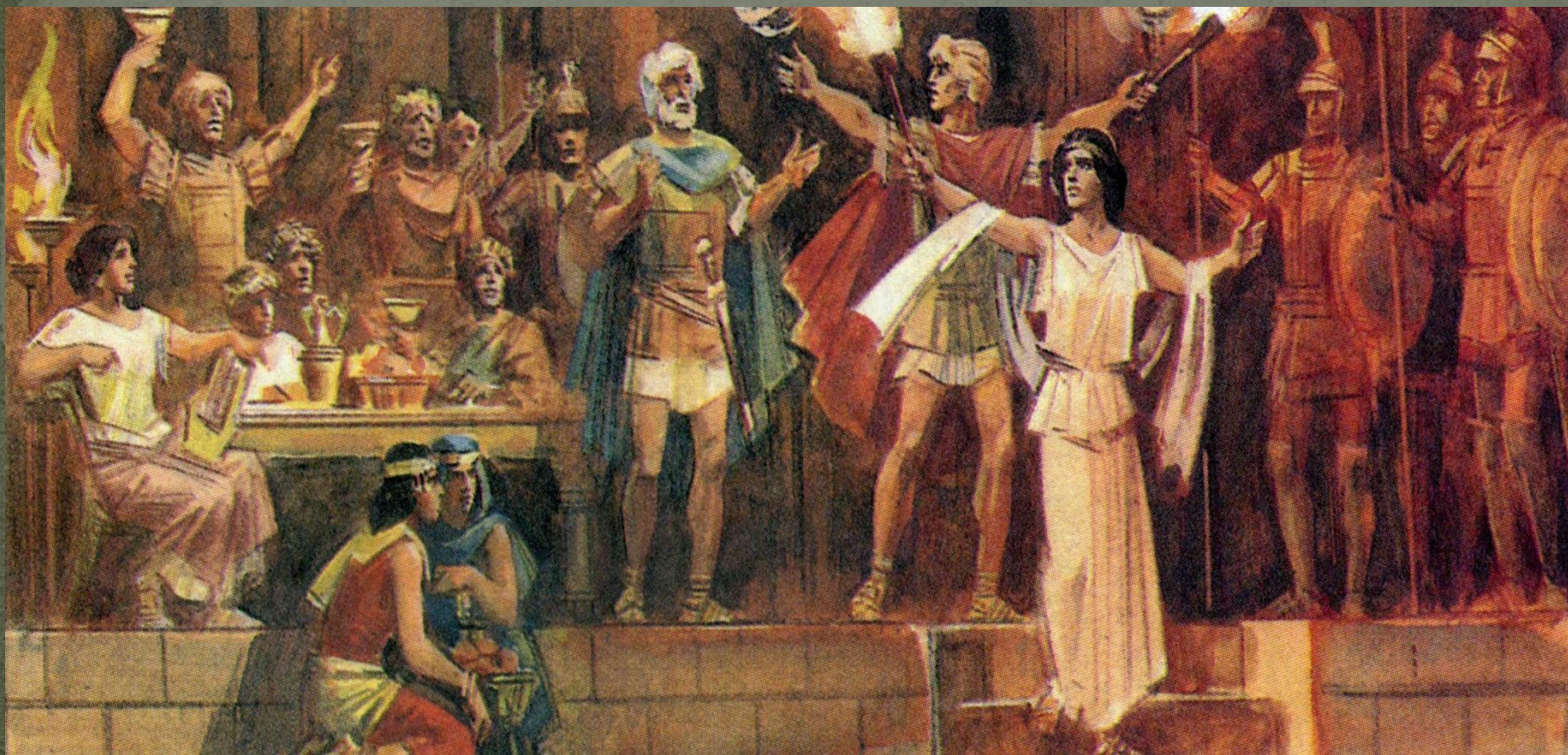
Таис призывает поджечь Персеполь