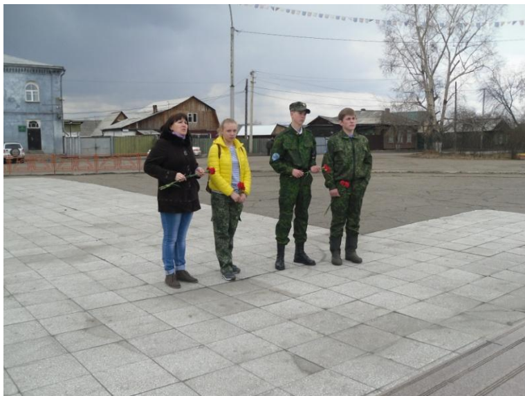
Традиционное Возложение цветов к памятнику «Скорбящая мать»