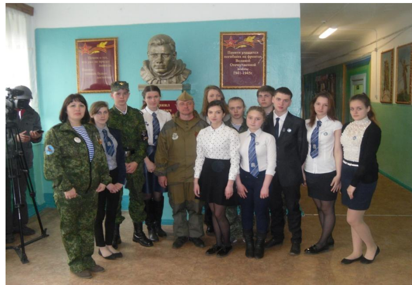
Совместное фото с участником Всероссийской акции «Знамя Победы»