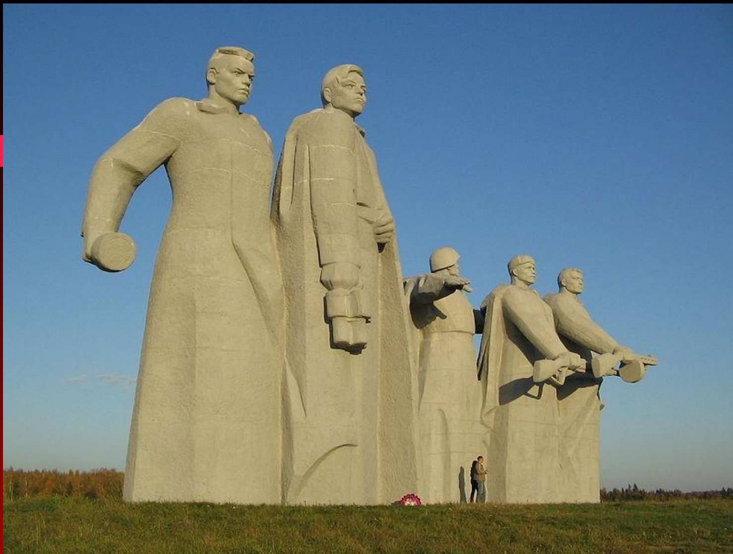
«Мемориал Героям Панфиловцам» у разъезда Дубосеково