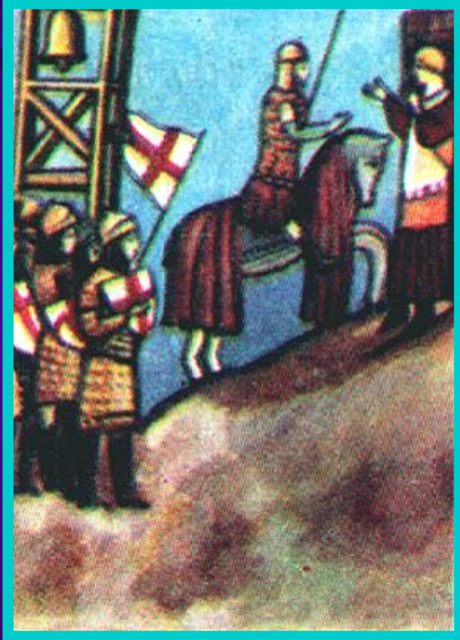
Победа гибеллинов при Монтаперти в 1260 г.

В это время образовались 2 политические группировки-Гвельфы(Вельфы) и Гибеллины(Вайблинген). Гвельфы стояли за папу, а Гибеллины за императора. Позднее в эти группы вошли соперничавшие города. Они выдвигали своих пап и императоров. Люди делали выбор из их, постоянно менявшихся взглядов.