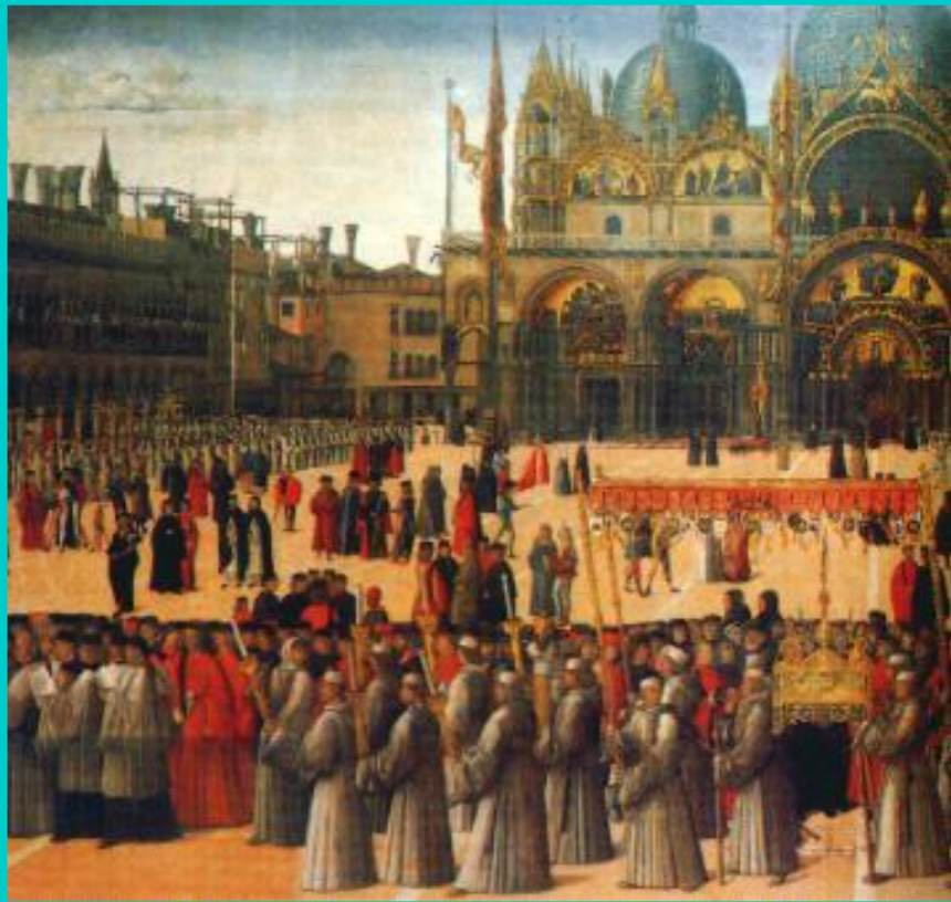
Дж. Беллини. Образ предержащей власти. Фрагмент.

До 19 в. Италия была раздробленной страной. В стране было много городов.