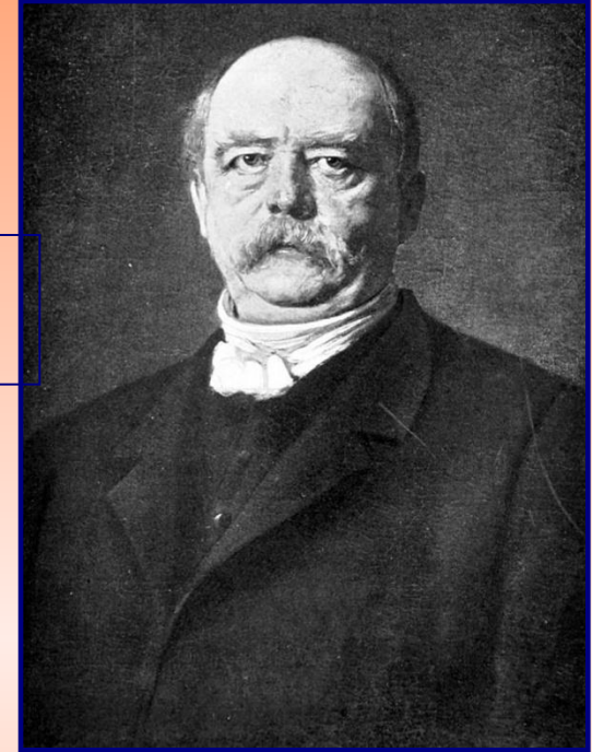
Отто фон Бисмарк

В середине 1880-х обострились франко-германские отношения. Военный министр Франции Ж.Буланже призывал к реваншу и укреплял армию. Германия тоже начала готовиться к войне. В январе 1887 г. Германия и Франция оказались на грани войны.