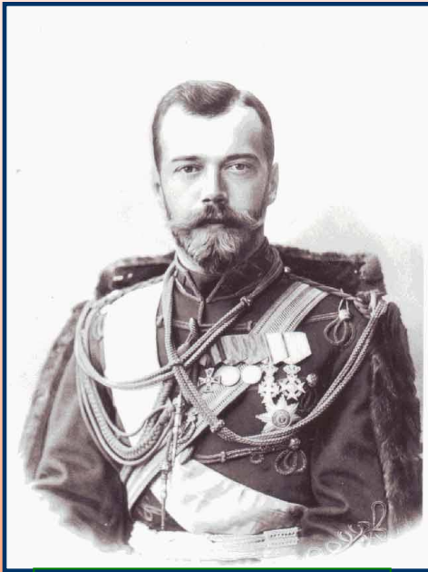
Император Николай II