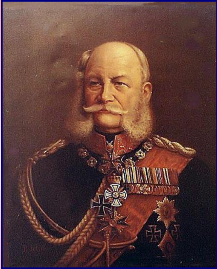
Германский император Вильгельм I

На смену общеевропейскому союзу пришло формирование двух противостоящих блоков. После образования Германской империи ее влияние в Европе начало быстро усиливаться. Это вызвало опасения у Англии и Франции.