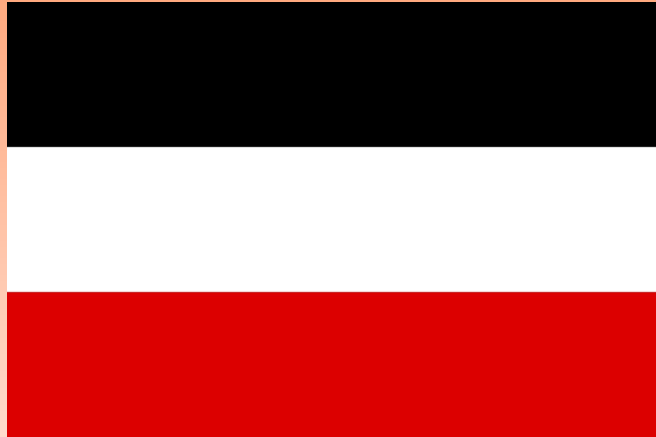
Флаг Германской империи