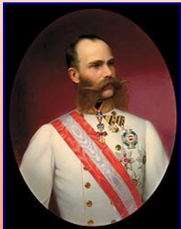
Франц Иосиф I

В 1872 г. Россия, Германия и Австрия создали «Союз 3-х императоров», но уже к концу 70-х гг. между его участниками обострились противоречия. Германия и Австро-Венгрия, обеспокоенные усилением влияния России на Балканах после русско-турецкой войны 1877-1878 гг., заставили ее пойти на уступки по Балканскому вопросу на Берлинском конгрессе летом 1878 г. Это показало ненадежность Германии как союзника, и Россия стала отдаляться от Германии и Австро-Венгрии.