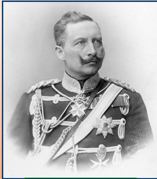
Кайзер Вильгельм II