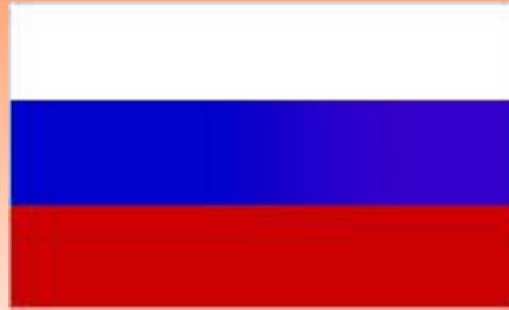
Флаг Российской империи

Опасаясь дальнейшего сближения России и Франции и учитывая, что Россия не стремилась к продлению Союза трех императоров (истекал в 1887 г.), Бисмарк заключил с Россией «договор перестраховки»: обе стороны обязались сохранять нейтралитет в случае войны с третьей державой, но Россия могла помочь Франции, при нападении на нее Германии, а Германия – Австро-Венгрии в случае нападения России.