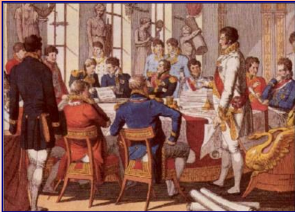
Подписание акта о создании Священного союза в 1815 г.

К концу 18 – началу 19 вв. в международных отношениях господствовала идея создания небольших блоков, но они были непрочны. После Венского конгресса ведущие страны решили, что мир в Европе можно обеспечить общеевропейским союзом. Попыткой создания общеевропейского союза стал Священный союз. Но у его участников возникли непреодолимые противоречия и этот блок распался.