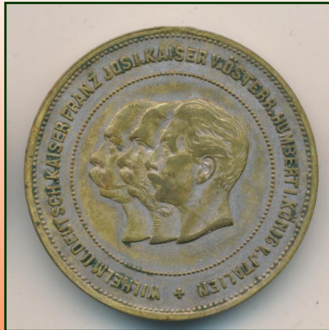
Медаль посвященная созданию Тройственного союза