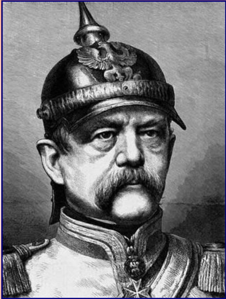
Отто фон Бисмарк

Первый канцлер Германской империи, опытный дипломат Отто фон Бисмарк считал столкновение с Англией и Францией неизбежным. Его целью было создание союза Германии, России и Австро-Венгрии. По силе такой перевесил бы союз Англии и Франции. Уже в 1871 г. Бисмарк начал подготовку к заключению австро-русско-германского союза.