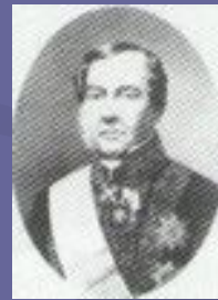
С.С. Ланской (1855-1861)