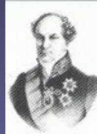
А.Н. Голицин (1819)