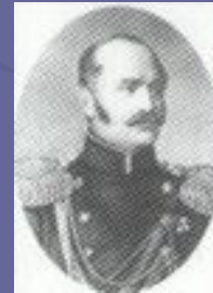
Д.Г. Бибиков (1852-1855)