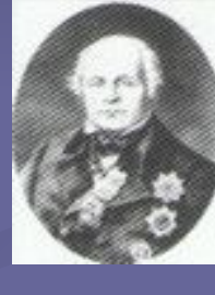
Д.Н. Блудов (1832-1839)