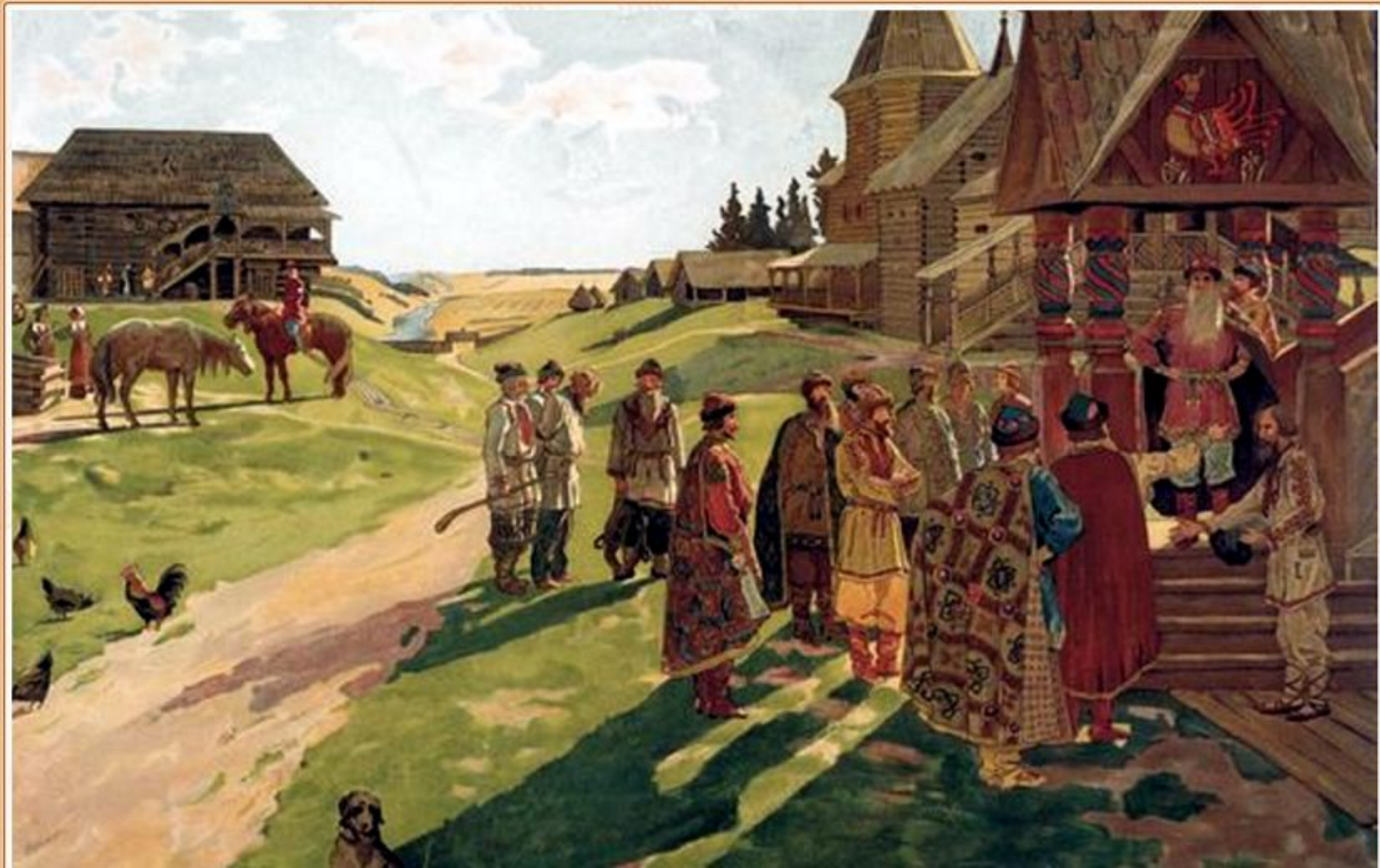
В усадьбе князя