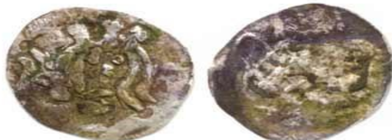
Монета Ягайло Ольгердовича, Вильно, 1387-1388 гг. Серебро, диаметр 14 мм, вес 0.60 гр.