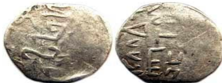
Монета Дмитрия Ольгердовича, Брянск, 1373-1376 гг. Серебро, диаметр 16 мм, вес 1.10 гр.