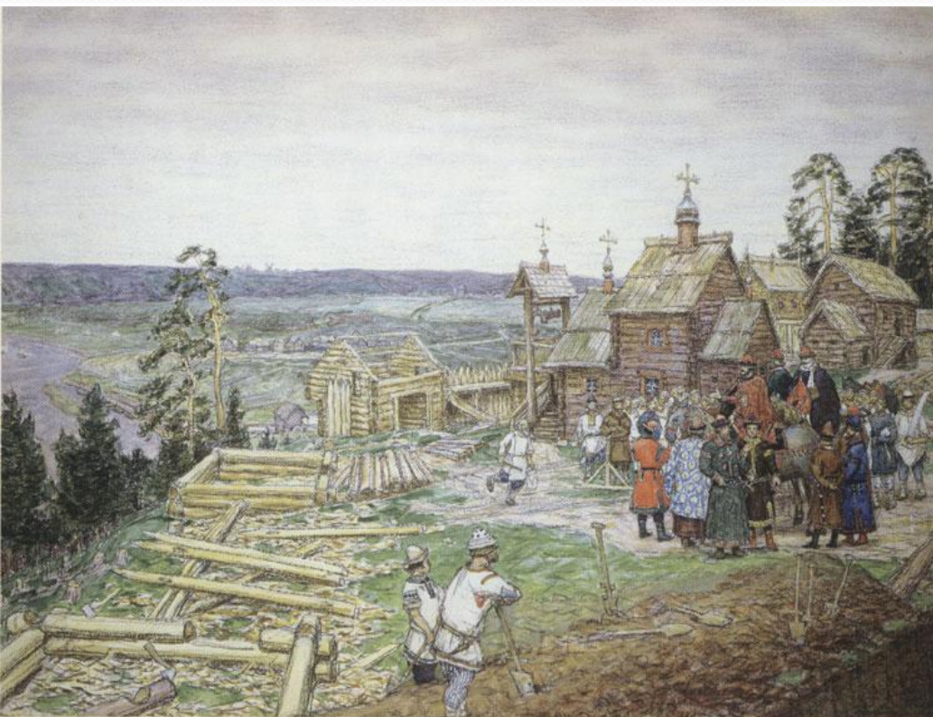
А. ВАСНЕЦОВ Освоение Москвы

Строил новые города (считается основателем Москвы – 1147 год)