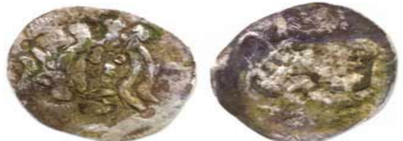
Монета Ягайло Ольгердовича, Вильно, 1387-1388 гг. Серебро, диаметр 14 мм, вес 0.60 гр.