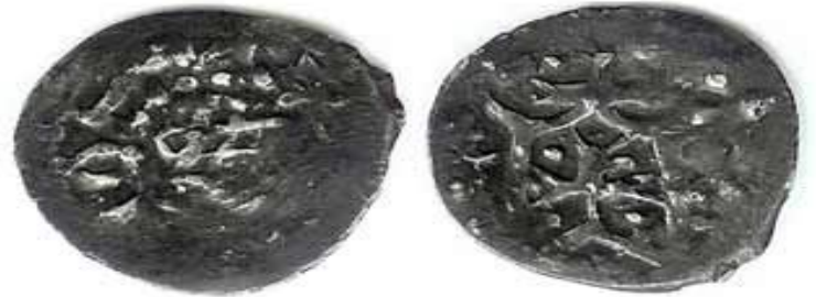
Монета Владимира Ольгердовича, Киев, 1363-1377 гг. Серебро, диаметр 14 мм, вес 0.50 гр.