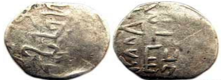
Монета Дмитрия Ольгердовича, Брянск, 1373-1376 гг. Серебро, диаметр 16 мм, вес 1.10 гр.