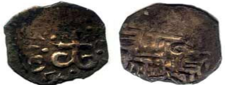
Монета Александра Наримонтовича, Стародуб, 1367-1370 гг. Серебро, диаметр 16 мм, вес 1.45 гр.