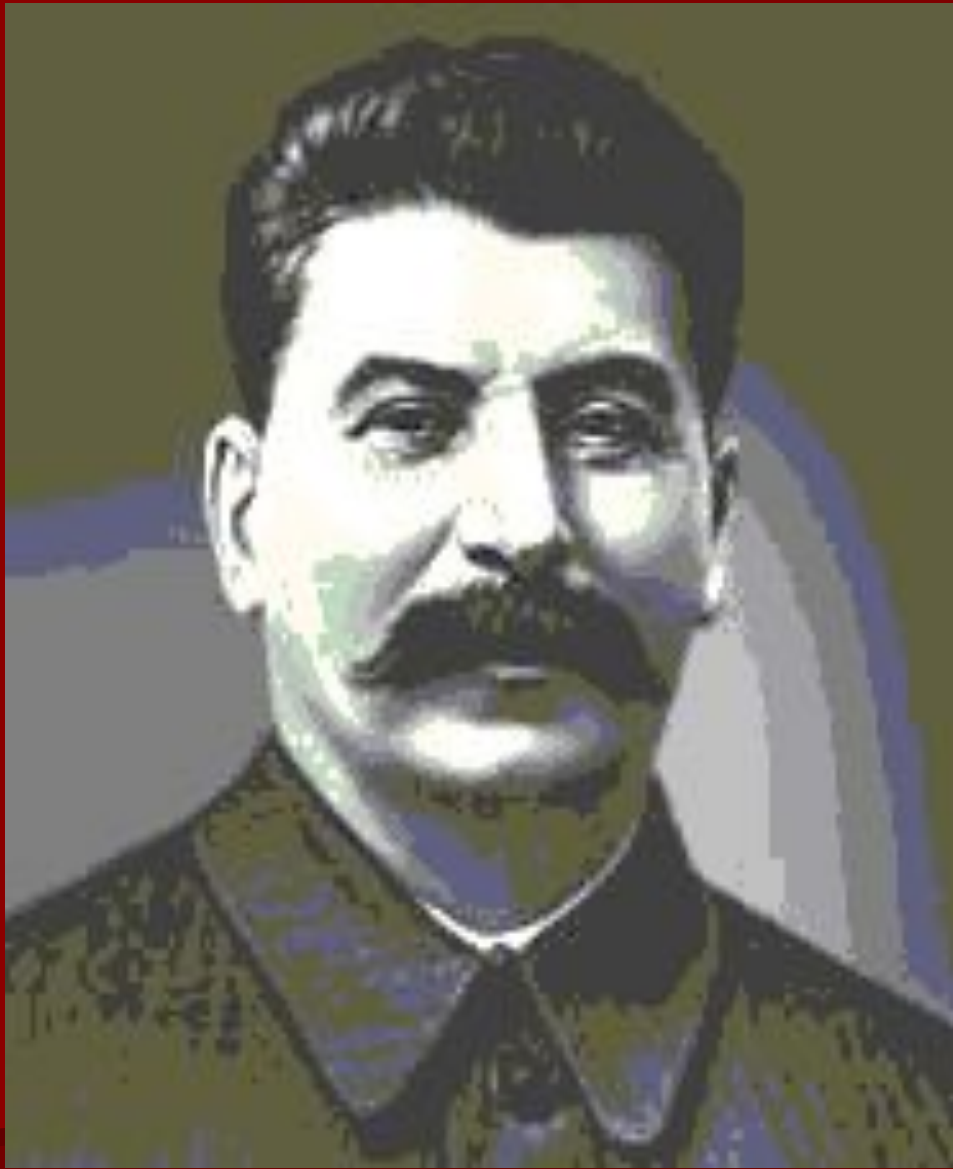
Иосиф Виссарионович Сталин (1879-1953 гг.)