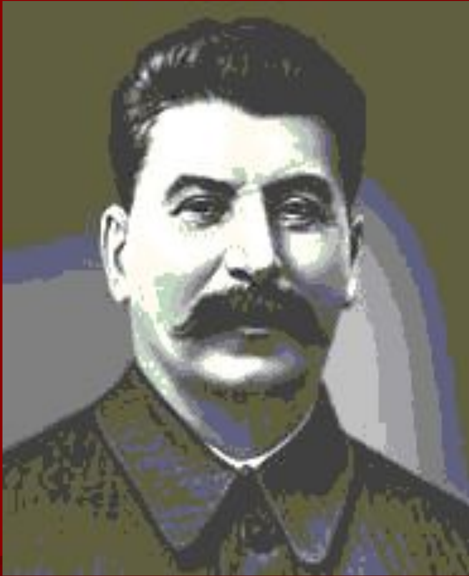
Иосиф Виссарионович Сталин (1879-1953 гг.)