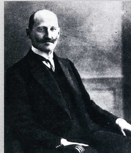
Председатель Второй Государственной Думы Ф.А.Головин