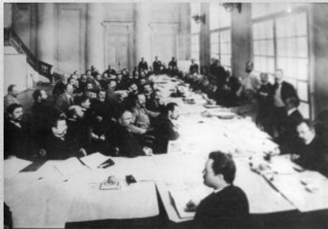
Заседание аграрной комиссии I Государственной Думы, Санкт-Петербург, май 1906