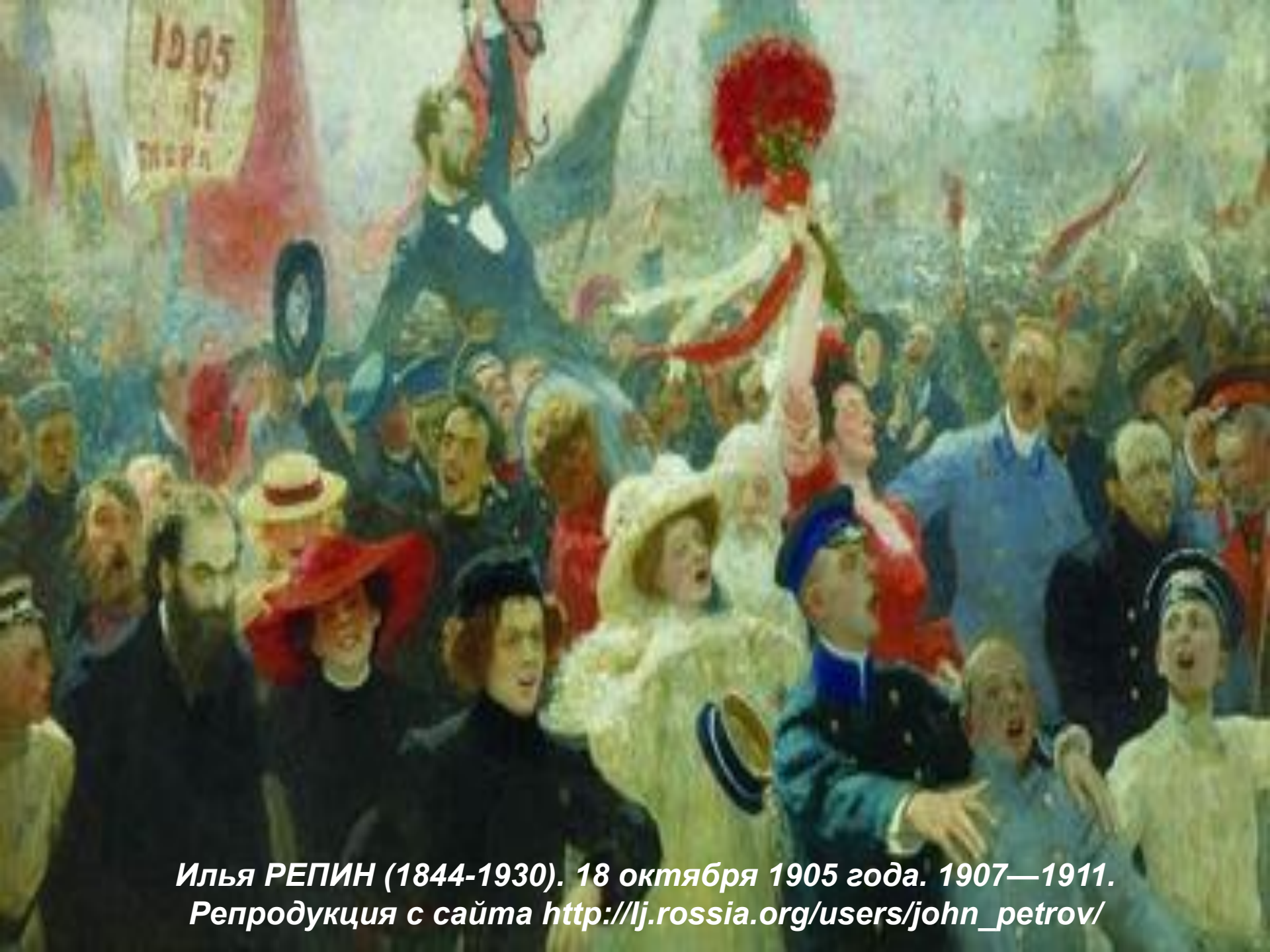
Илья РЕПИН (1844-1930). 18 октября 1905 года. 1907—1911.