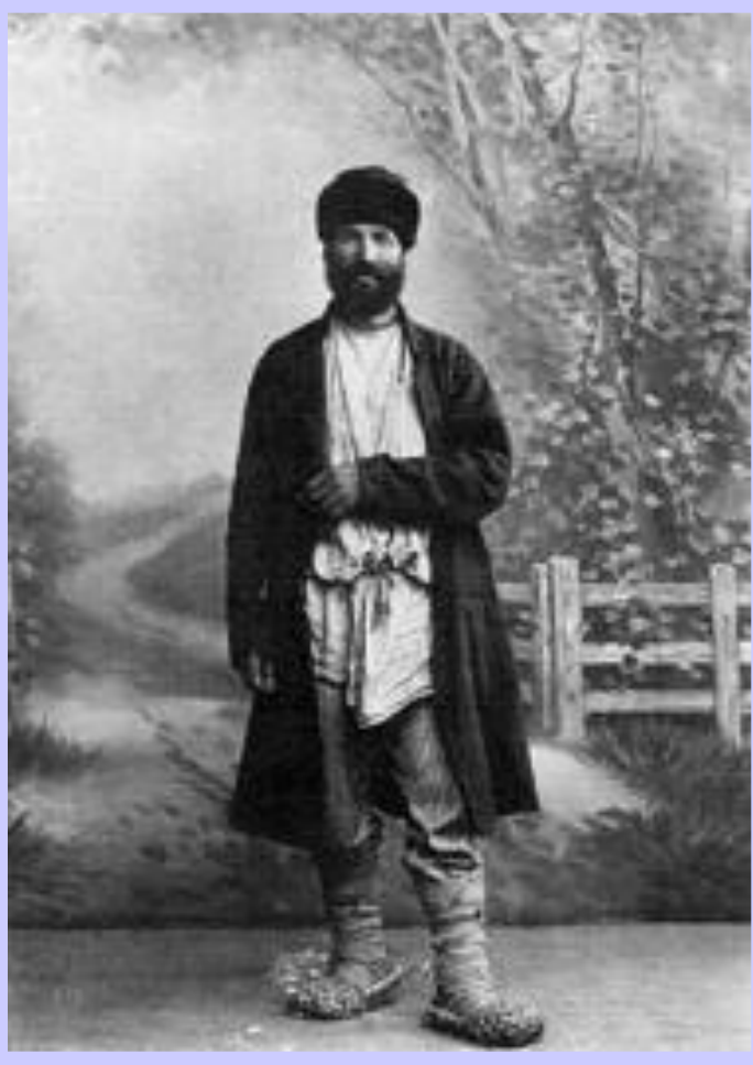
Ходок в Думу от рязанских крестьян.

После подавления Декабрьского вооруженного восстания забастовочное движение пошло на убыль. В 1905 г. бастовало 3 млн. чел., в 1906-1 млн., в 1907-740 тыс. Наибольшую активность проявляли текстильщики, а стачки носили в основном экономический характер. рабочие выступали против попыток увеличить рабочий день и снижения зарплаты. В большинстве случаев фабриканты шли на