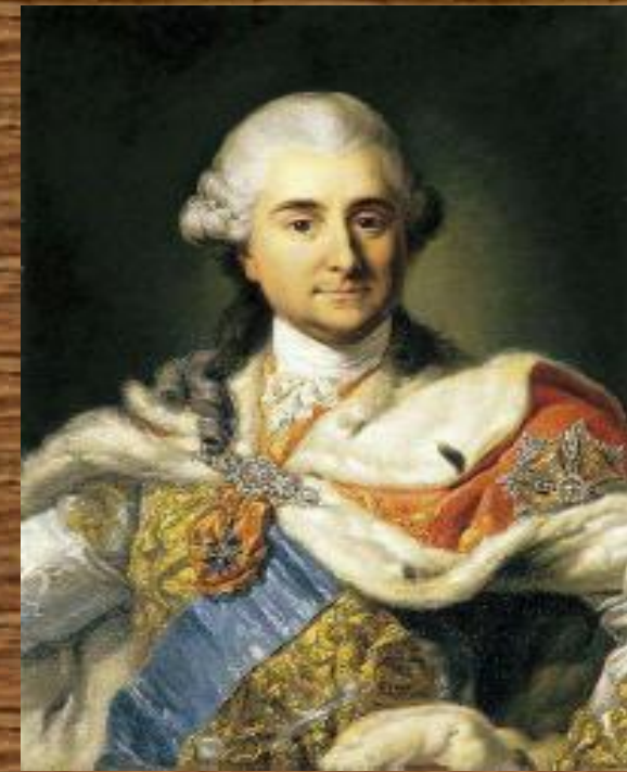
Станислав Август Понятовский

Должность короля была выборной и полностью зависело от вольностей магнатов и шляхты