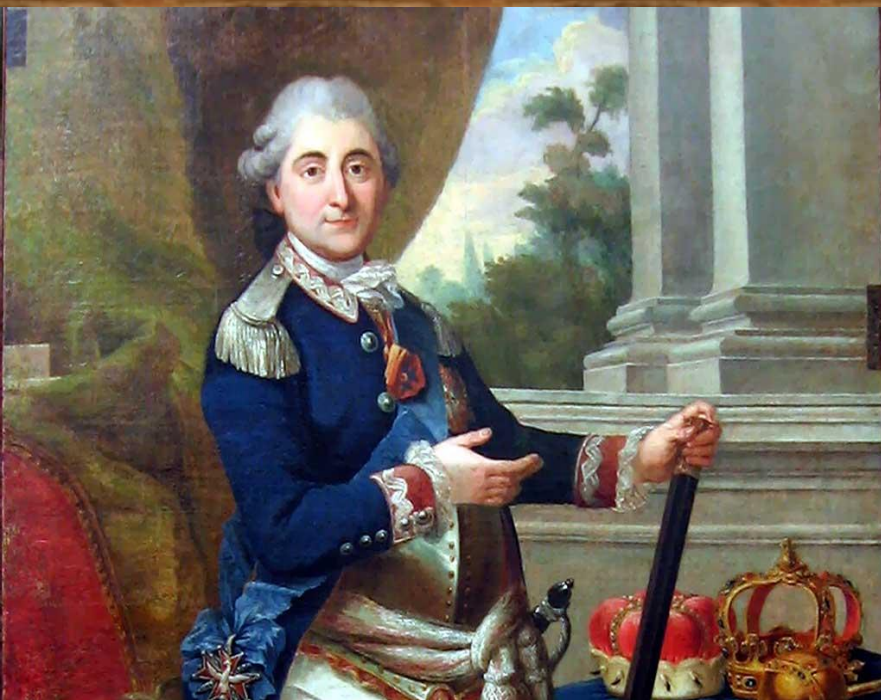
Станислав Август Понятовский

Речь Посполитая просуществовала с 1569 по 1795 г