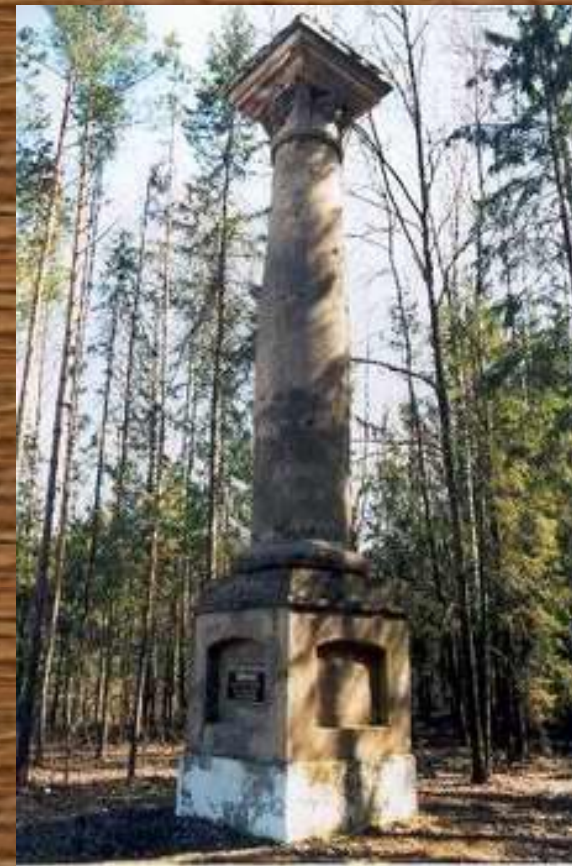
Колонна в честь Конституции

Хотя Конституция заложила основу для выведения Речи Посполитой из кризиса, однако время на реформирование государства было уже упущено.