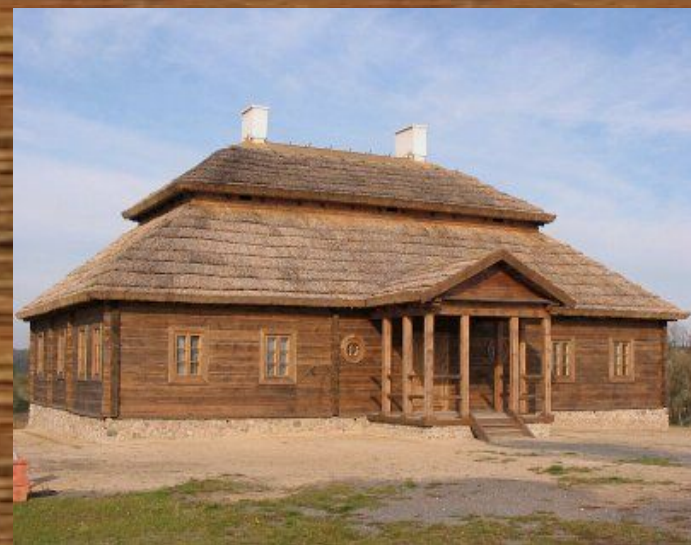
Усадьба в Меречовщине, место рождения Костюшко

Костюшко является национальным героем США и Польши, почетным гражданином Франции. Он руководил восстанием на территории Польши.