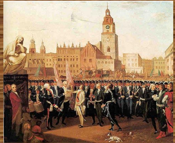
Провозглашение восстания в Кракове. присяга Костюшко

Активное участие в нем приняли патриотическая шляхта, мещанство, крестьянство, священства. Восстание проходило под лозунгом "Свобода, цельность, независимость".