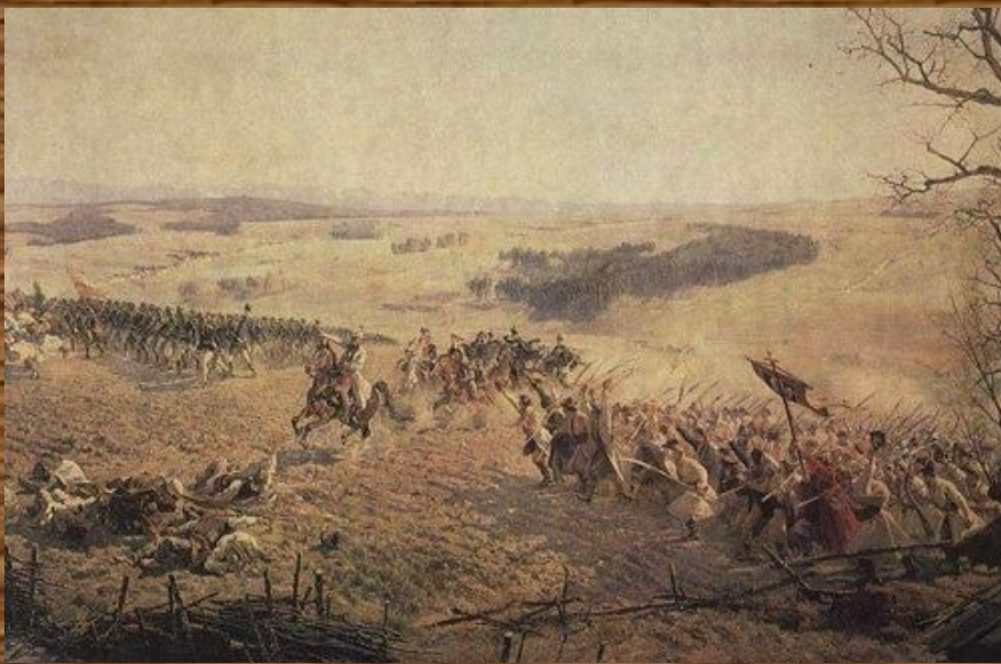
Битва пад Рацлавіцамі

На территории Беларуси косинеры составляли до 1/3 от числа повстанцев. Но добиться массовой поддержки населения руководителям восстания не удалось