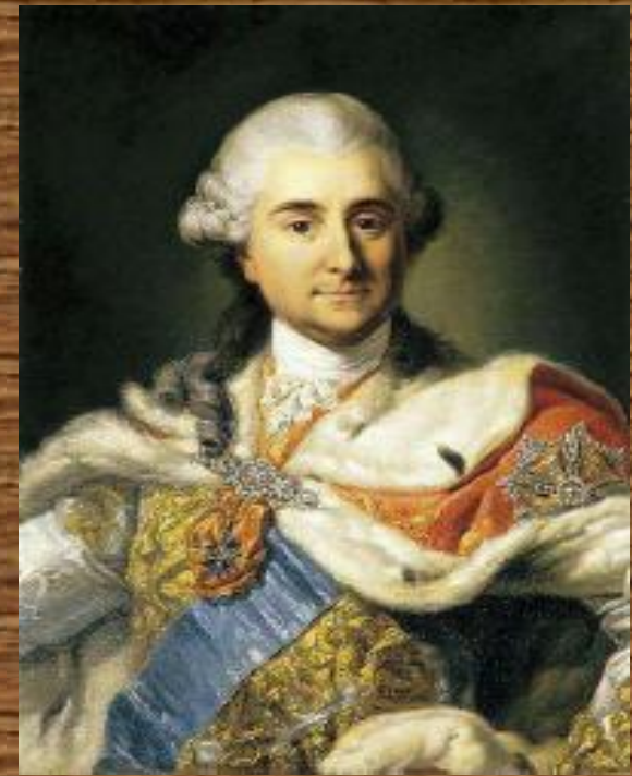
Станислав Август Панятовский

Должность короля была выборной и полностью зависело от вольностей магнатов и шляхты