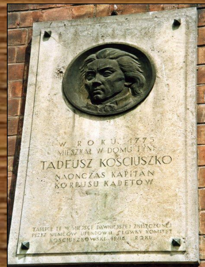
Мемориальная доска Т. Костюшко в Кракове

Последний король Речи Посполитой Станислав Август Понятовский отрекся от престола. Речь Посполитая прекратила свое существование.