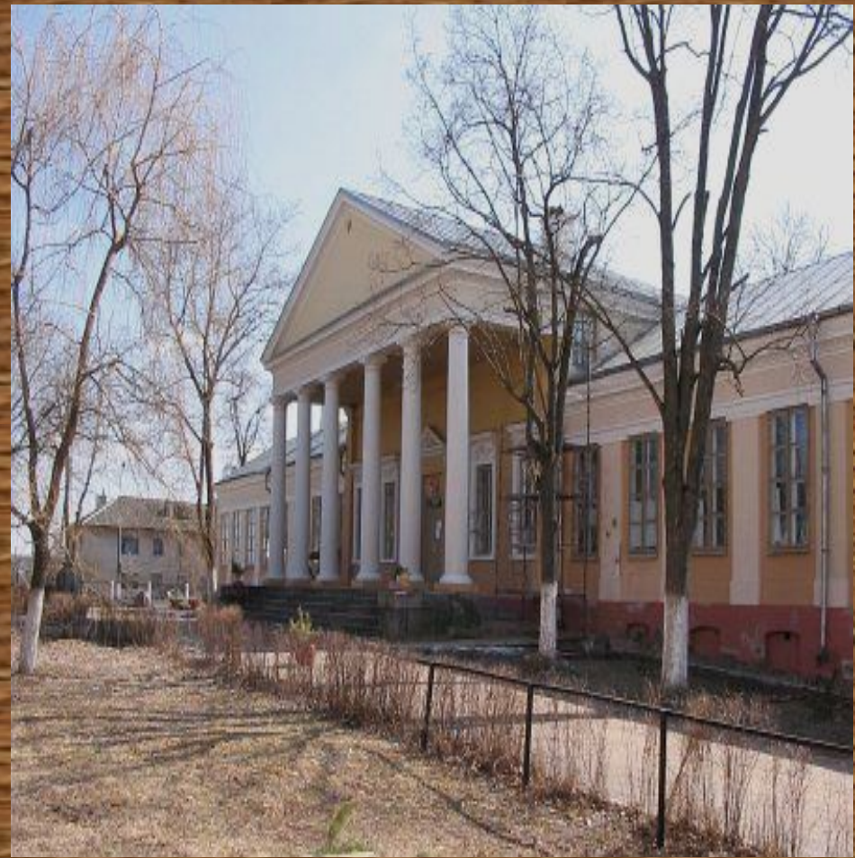
Дворец А. Тызенгауза в Поставах

Со второй половины XVIII в. был осуществлен целый ряд реформ, направленных на усиление Речи Посполитой. В экономической области определенный успех имели реформы А.Тызенгауза, благодаря которым стала закрепляться такая форма промышленного производства как мануфактура.