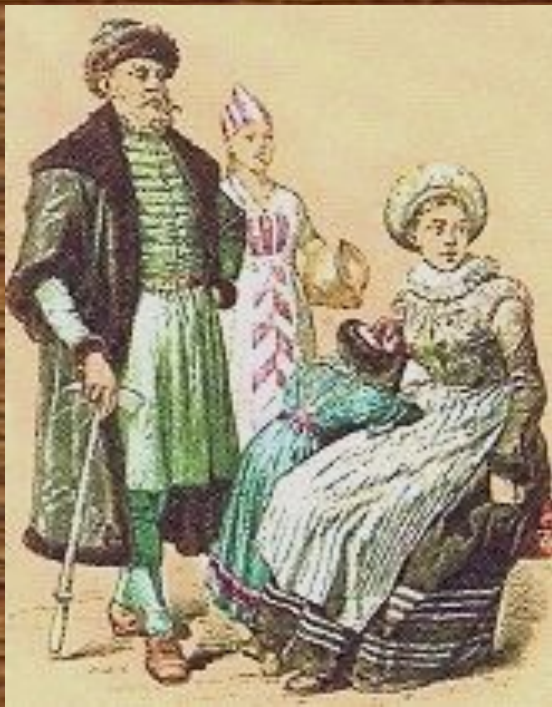
Магнат с семьёй

Попытки ограничить власть магнатов привели к проявлениям недовольства с их стороны. Междоусобная борьба магнатов осложнилась недовольством многочисленной знати католического вероисповедания, которая была уравнена в правах с некатоликов - православными и протестантами, которых называли диссидентами.