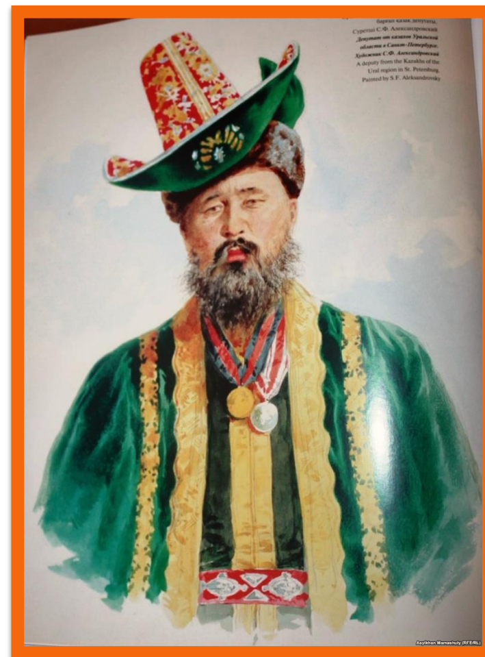
Байраг казан, казак, Суретші С. Ф. Александровский Дарыннан от казанлы Уралдык областы в Санкт-Петербург, Художник С. Ф. Александровский A deputy from the Kazan of the Ural region in St. Petersburg, Painted by S. F. Aleksandrovsky

Баи – у казахов-кочевников баи составляли довольно многочисленную прослойку общества. Однако баи не составляли особое сословие: они были и среди султанов, и среди биев, и среди рядовых кочевников. Иными словами, баи представляли собой социально-неоднородную группу общества. Богатство, материальное благополучие, несомненно давали огромные выгоды и определяли престиж в обществе. Тем не менее с большим состоянием не соединялись особые политические права. Значение отдельных баев в обществе определялось значением сословия, к которому они принадлежат. Какой-нибудь султан, в имущественном отношении мог быть даже нищим, но он пользовался всеми правами и привилегиями, даваемыми Законом этой социальной группе общества в постоянное обладание.