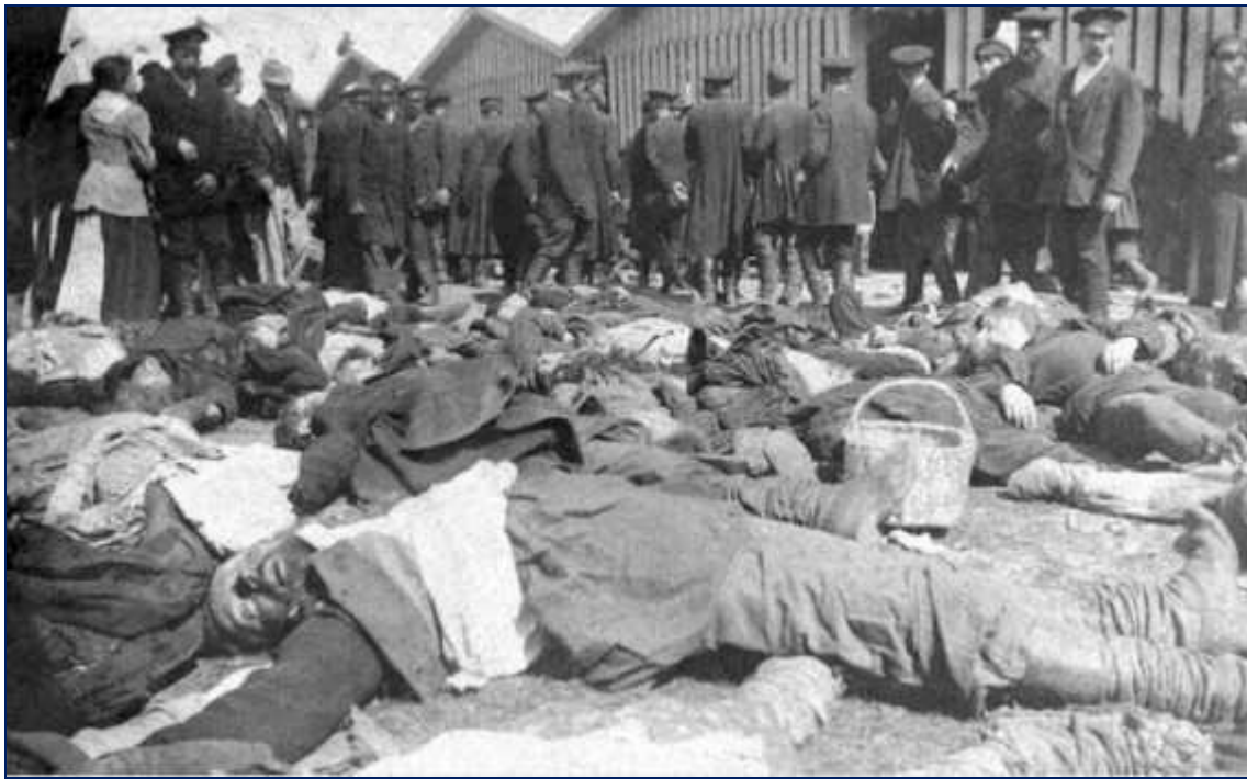
Жертвы Ходынской трагедии