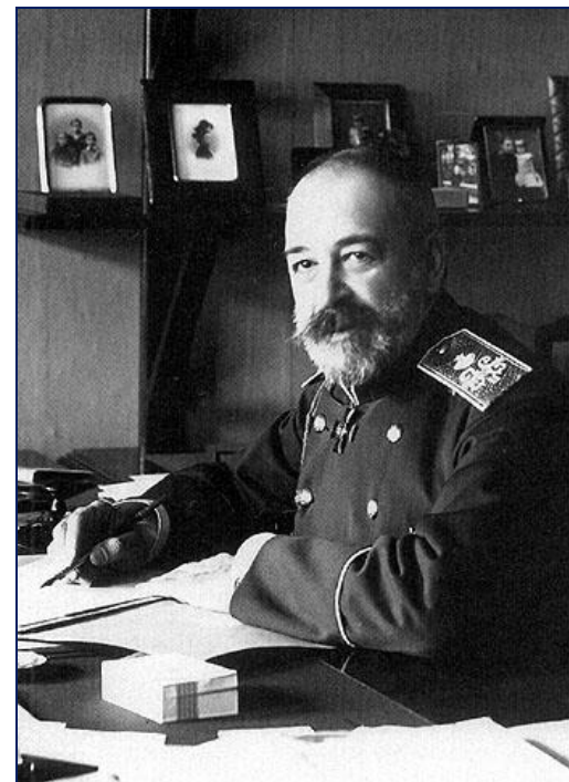
Князь П.Святополк-Мирский. МВД.

В 1904 г. Царь издал указ о некотором послаблении политики, однако ни о каком народном представительстве речи не шло. Самодержавие должно было оставаться незыблемым.