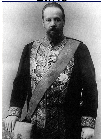
Министр финансов С. Витте