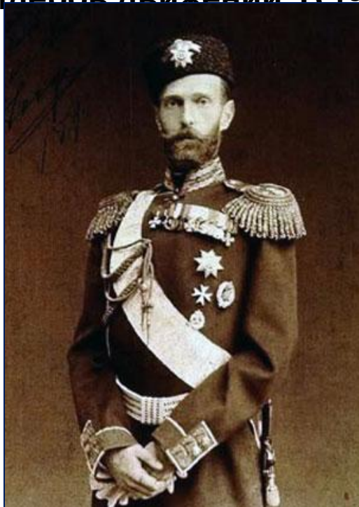
Великий князь Сергей Александрович, губернатор Москвы.

4. Рост рабочего движения привел к попытке власти взять его под контроль . Начальник охранного отделения С.Зубатов пытался внушить рабочим, что положение рабочих может улучшить лишь государство. При поддержке князя Сергея Александровича в Москве и др. городах создаются легальные рабочие организации. Правительство с помощью рабочих не спешило и они начинают участвовать во всероссийских стачках. Зубатова отправили в отставку, а организации разогнали. МВД Плеве начинает внедрять в ряды рабочих агентов с целью выявления лидеров движений. В 1904 г. Плеве был убит революционерами