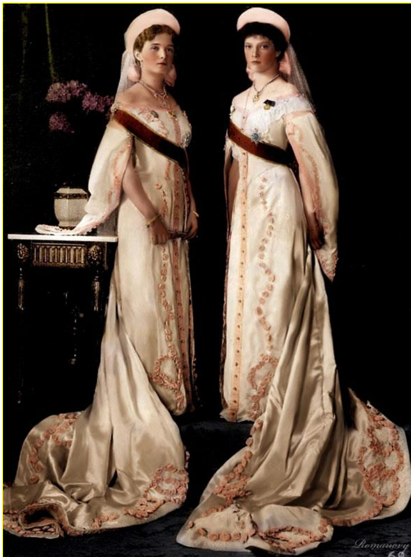
Великие княжны Ольга и Татьяна