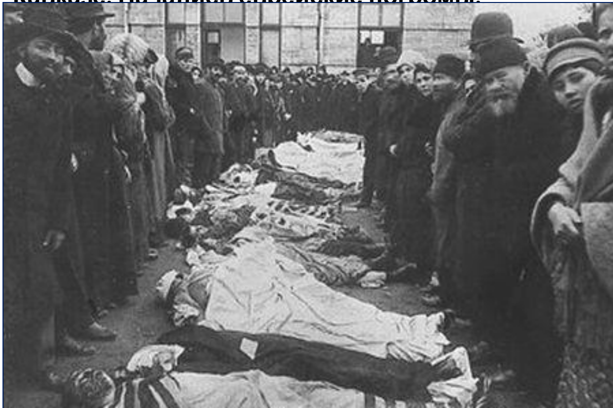
Жертвы еврейских погромов в Кишиневе в 1903 г.

3. Политика царя вызвала разочарование в обществе . Начались студенческие волнения. В феврале 1901 г. Террористом был убит министр просвещения Н.Боголепов. Вспыхнули крестьянские волнения. В 1899 г. Были ограничены права финского сейма, волнения прокатились на Кавказе. Начались еврейские погромы.