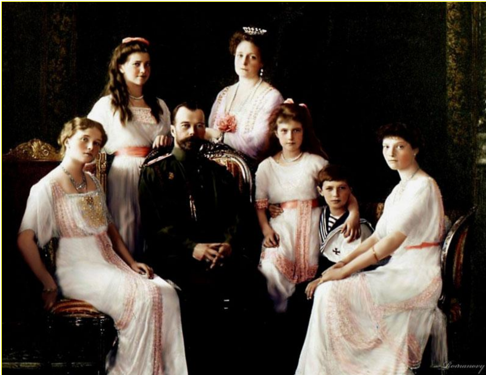
Николай II с семьёй.