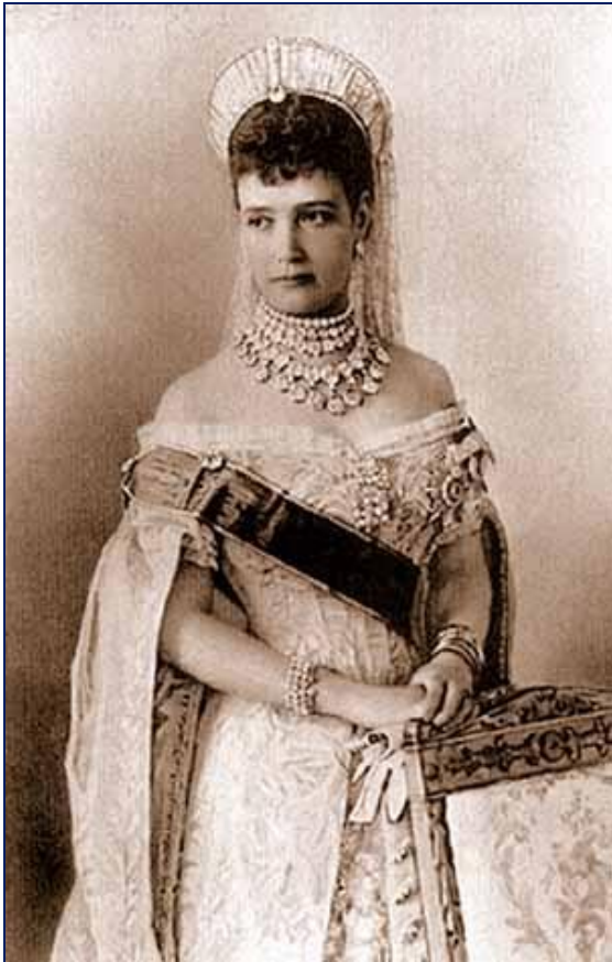
Мать царя, императрица Мария Федоровна

Во время праздничных гуляний в честь коронации в мае 1896 г. На Ходынском поле случилась давка. Единственный сын царя Алексей, страдал неизлечимой болезнью. Добрый и бесхарактерный, Николай II находился под влиянием сначала матери, а затем жены Александры Федоровны. Царь был отличным семьянином, прекрасно воспитанным, сдержанным.