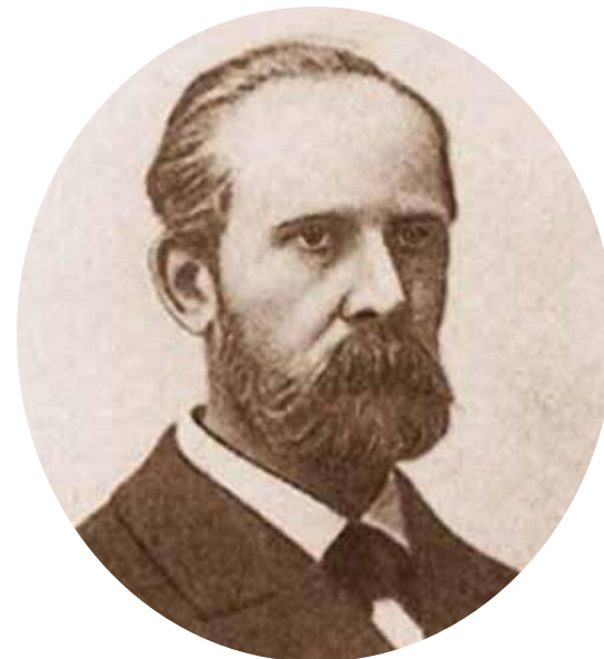
Министр просвещения Н. Боголепов.