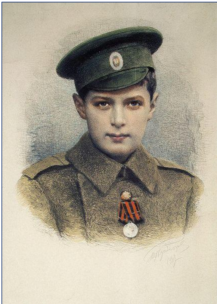
Сын Николая II- Цесаревич и Великий князь Алексей Николаевич. (1904-1918 гг.)

Общество ожидало от нового царя реформ, однако в своей первой публичной речи император заявил, что будет охранять основы самодержавия твердо и неуклонно, как его «незабвенный покойный родитель».