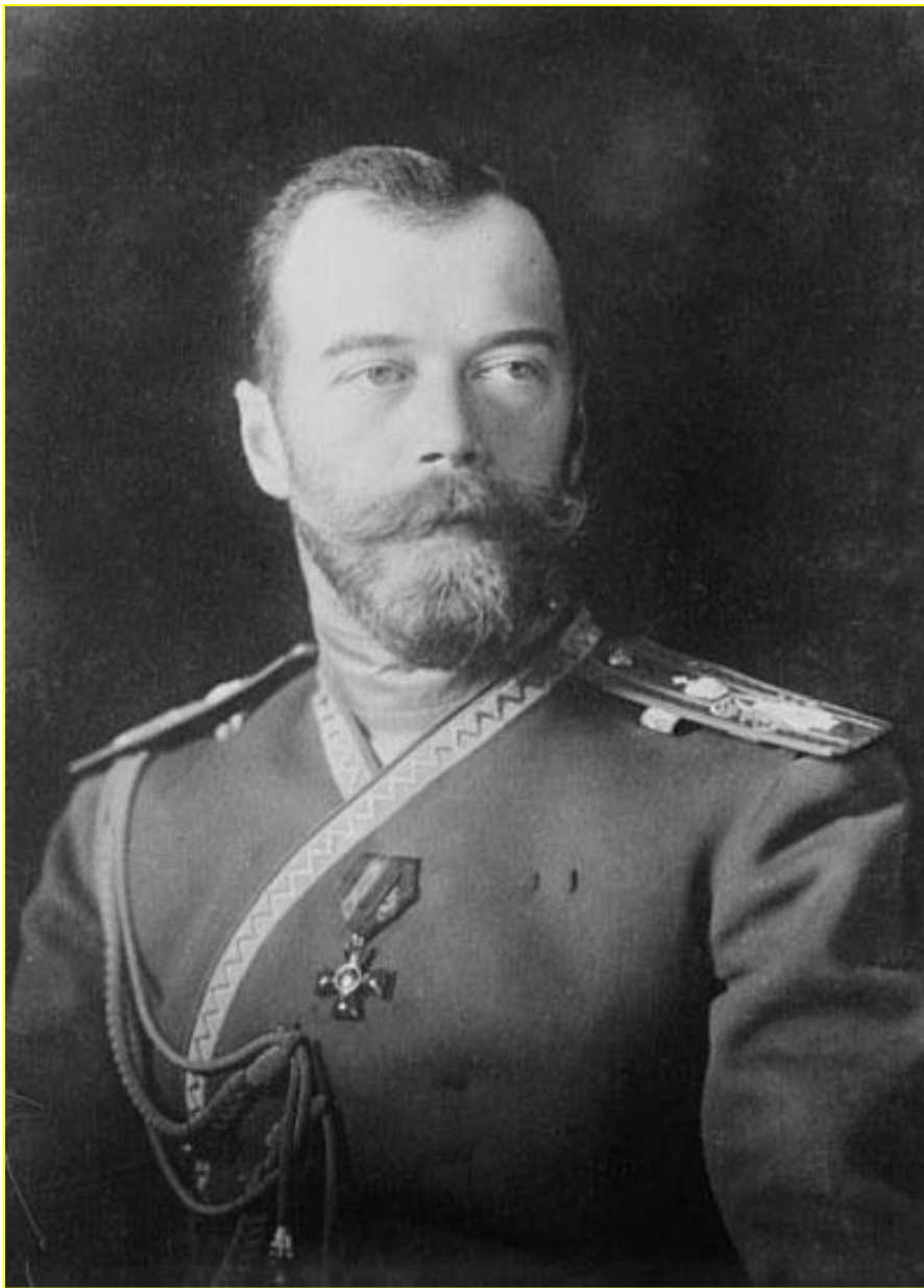
Император Николай II Александрович (1894-1917 гг.)

20 октября 1894 г. Умер Александр III. На престол вступил его сын Николай II . Родился 6 мая 1868 г. в Санкт-Петербурге. Рос он, довольно подвижным, даже озорным мальчиком. Образование наследник получил домашнее: ему прочли лекции по курсу гимназии, а затем юридического факультета и Академии Генштаба. Николай свободно владел тремя языками; английским, немецким и французским. Что касается политических взглядов цесаревича, то они во многом формировались под влиянием обер-прокурора Синода К.Победоносцева . Из писателей царь ценил Гоголя, Пушкина. Любил одеваться на русский манер.