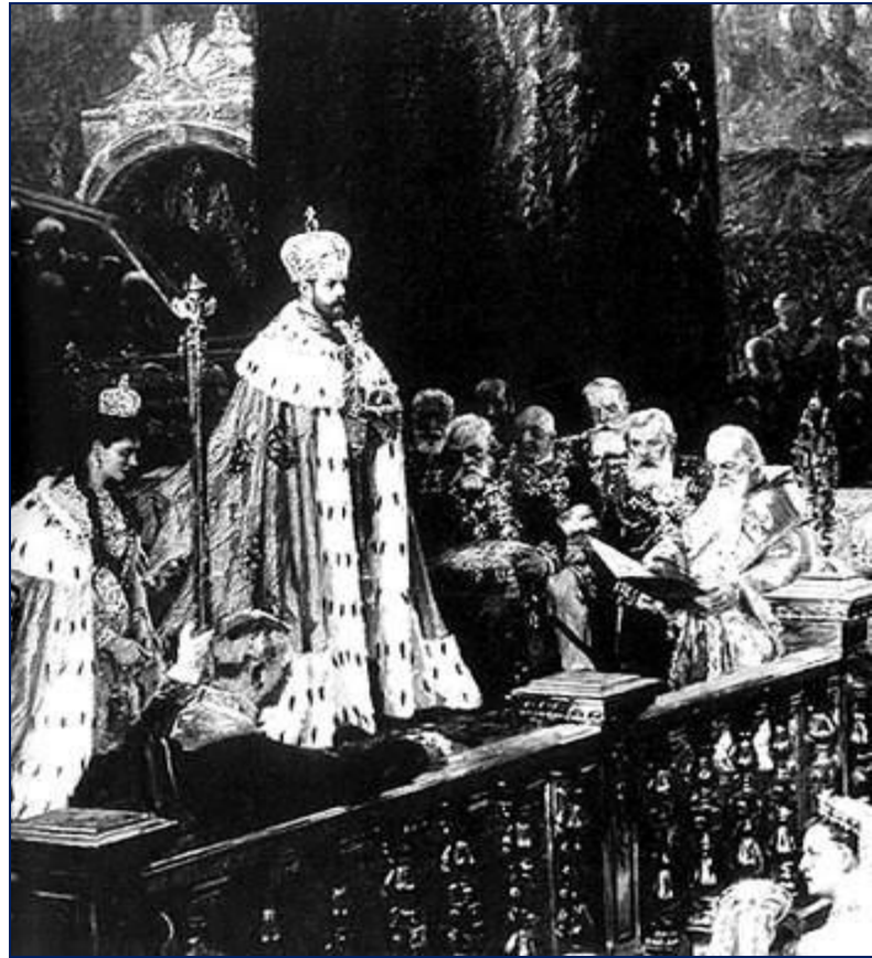
Коронация Николая II