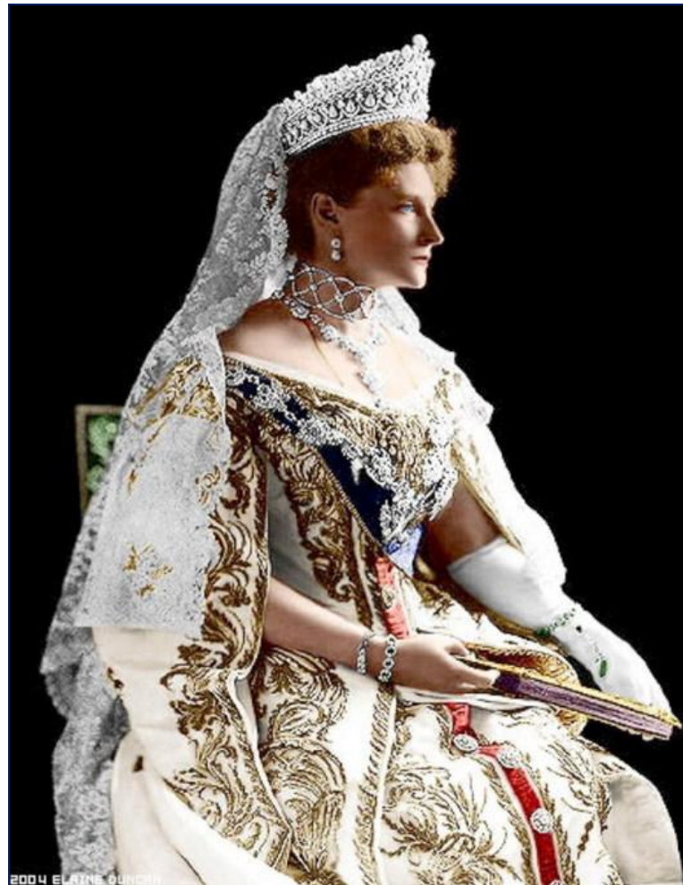
Императрица Александра Федоровна- жена Николая II