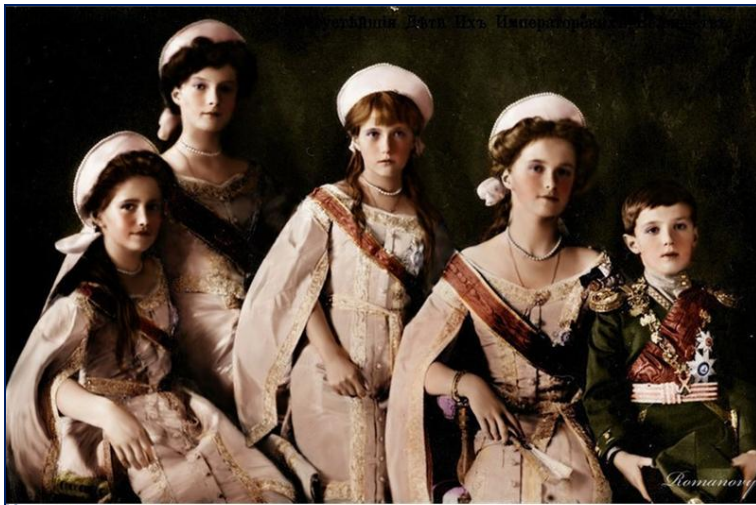
Дети Николая II