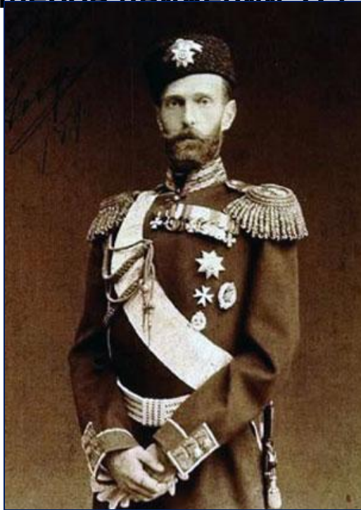
Великий князь Сергей Александрович, губернатор Москвы.

4. Рост рабочего движения привел к попытке власти взять его под контроль . Начальник охранного отделения С.Зубатов пытался внушить рабочим, что положение рабочих может улучшить лишь государство. При поддержке князя Сергея Александровича в Москве и др. городах создаются легальные рабочие организации. Правительство с помощью рабочих не спешило и они начинают участвовать во всероссийских стачках. Зубатова отправили в отставку, а организации разогнали. МВД Плеве начинает внедрять в ряды рабочих агентов с целью выявления лидеров движений. В 1904 г. Плеве был убит революционерами