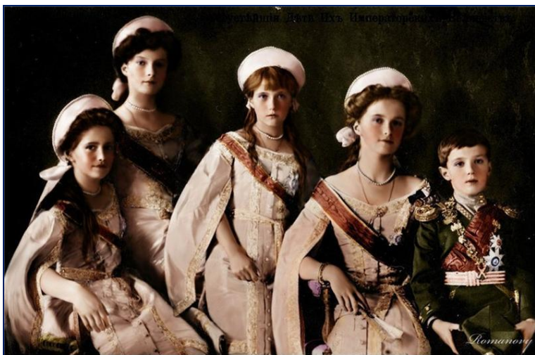
Дети Николая II