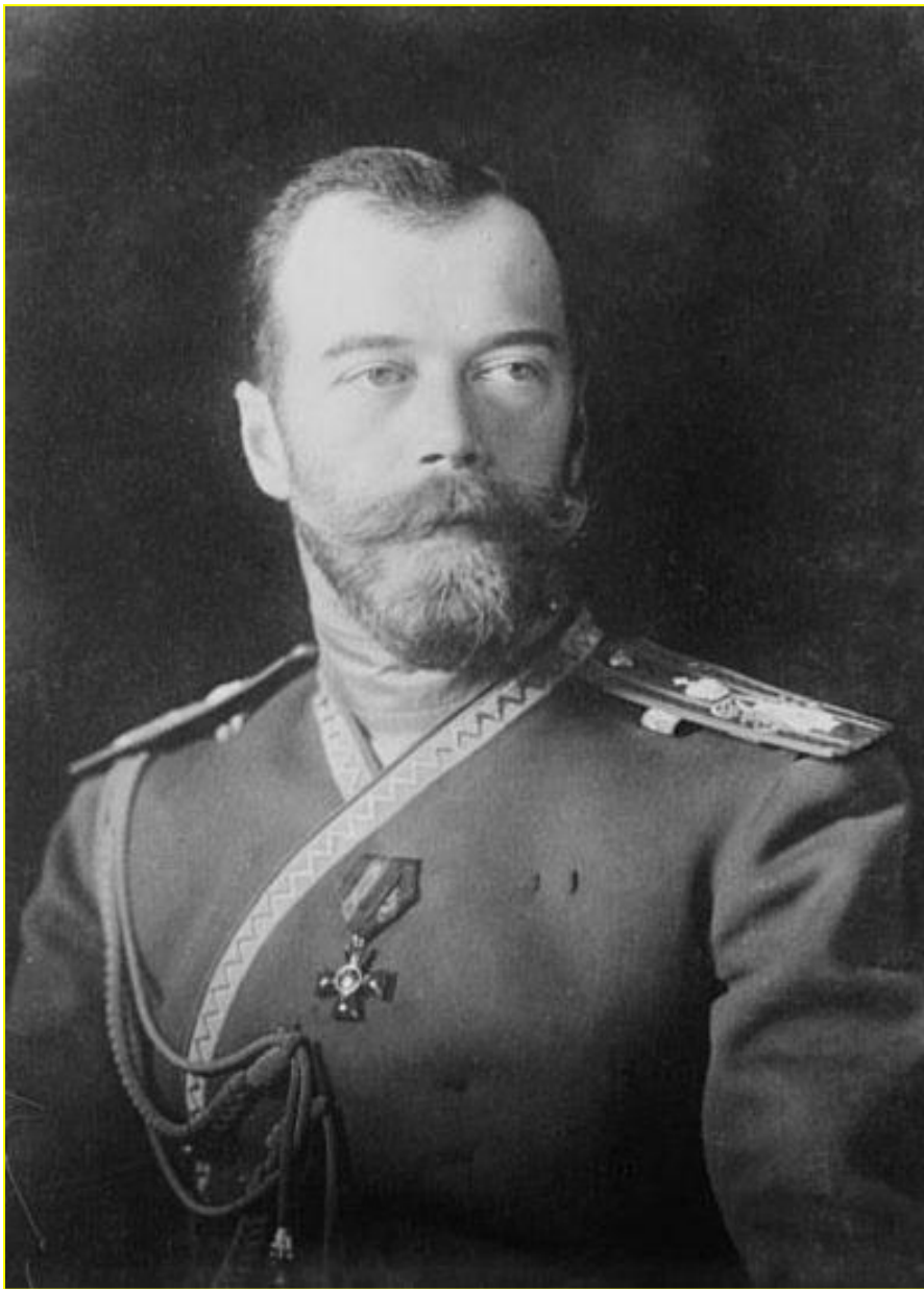
Император Николай II Александрович (1894-1917 гг.)

20 октября 1894 г. Умер Александр III. На престол вступил его сын Николай II . Родился 6 мая 1868 г. в Санкт-Петербурге. Рос он, довольно подвижным, даже озорным мальчиком. Образование наследник получил домашнее: ему прочли лекции по курсу гимназии, а затем юридического факультета и Академии Генштаба. Николай свободно владел тремя языками; английским, немецким и французским. Что касается политических взглядов цесаревича, то они во многом формировались под влиянием обер-прокурора Синода К.Победоносцева . Из писателей царь ценил Гоголя, Пушкина. Любил одеваться на русский манер.