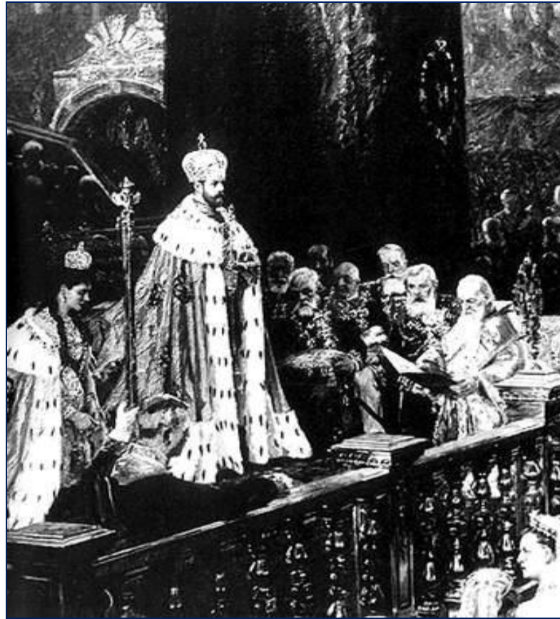
Коронация Николая II