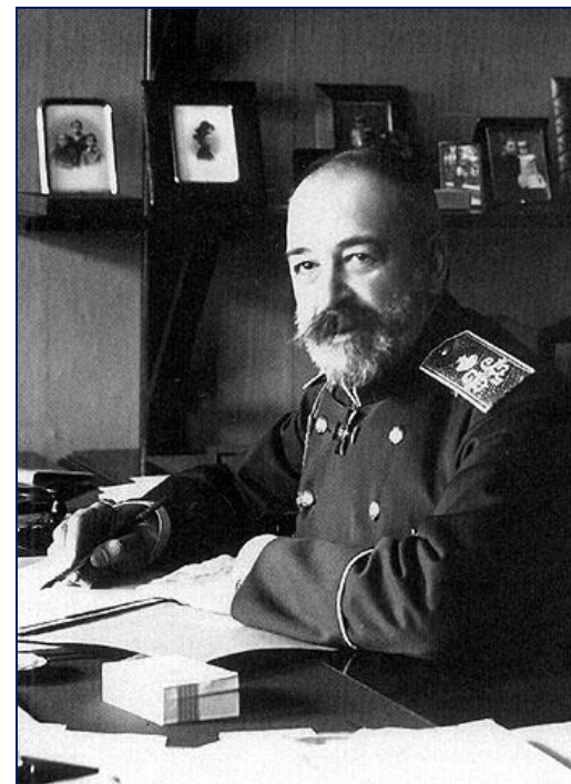
Князь П.Святополк-Мирский. МВД.

В 1904 г. Царь издал указ о некотором послаблении политики, однако ни о каком народном представительстве речи не шло. Самодержавие должно было оставаться незыблемым.