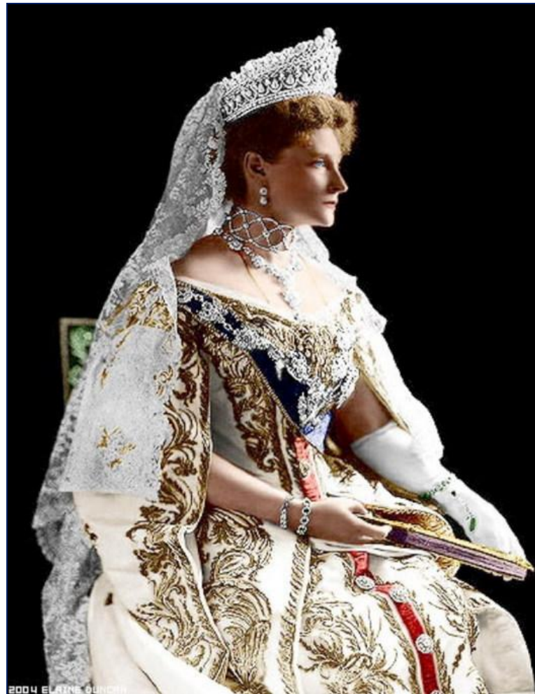
Императрица Александра Федоровна- жена Николая II