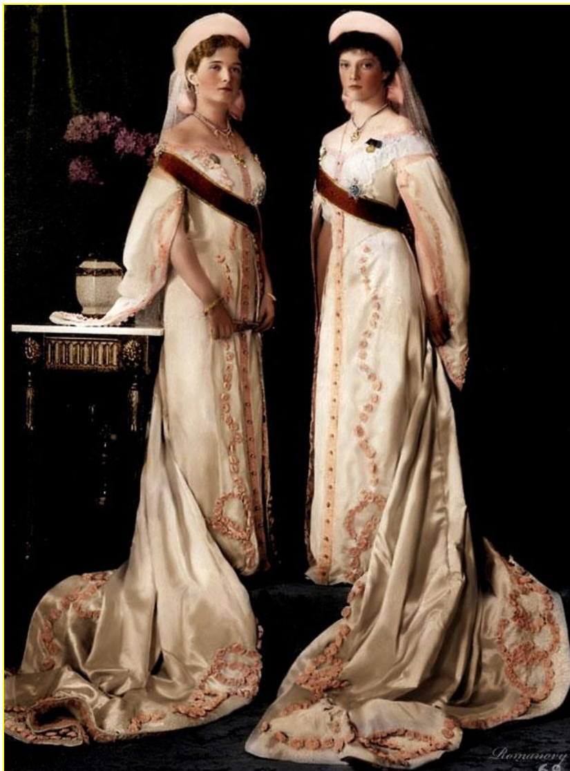
Великие княжны Ольга и Татьяна