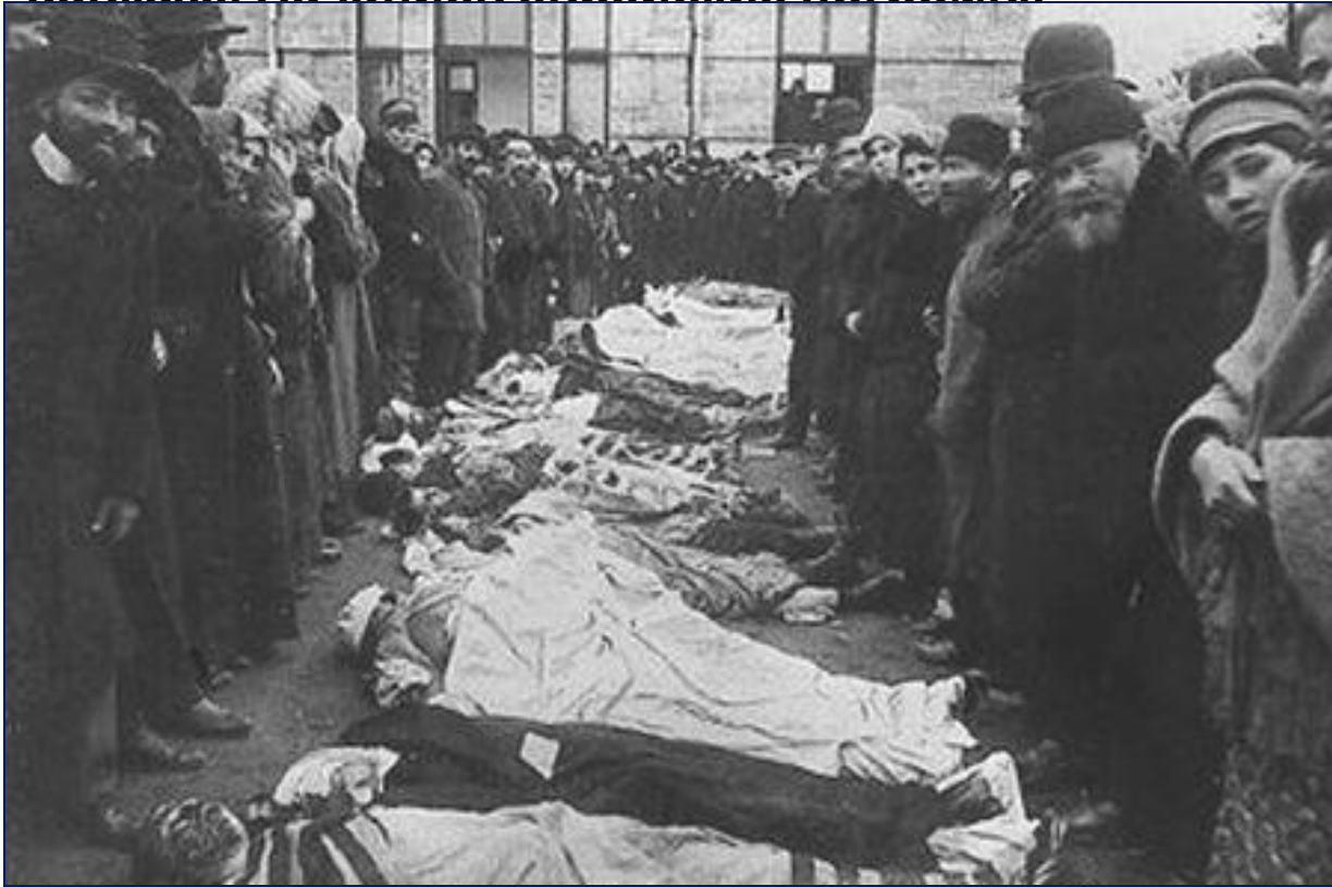
Жертвы еврейских погромов в Кишиневе в 1903 г.

3. Политика царя вызвала разочарование в обществе . Начались студенческие волнения. В феврале 1901 г. Террористом был убит министр просвещения Н.Боголепов. Вспыхнули крестьянские волнения. В 1899 г. Были ограничены права финского сейма, волнения прокатились на Кавказе. Начались еврейские погромы.