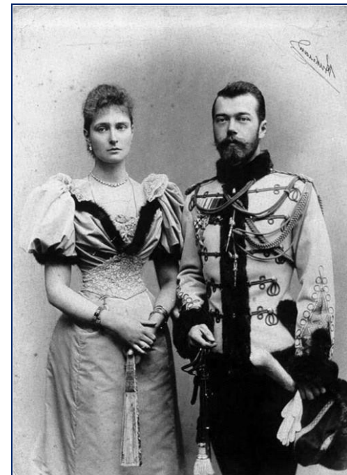
Николай и Александра