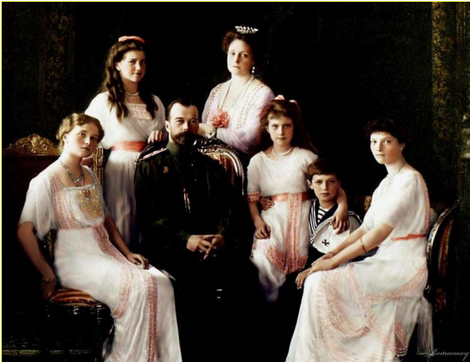
Николай II с семьёй.