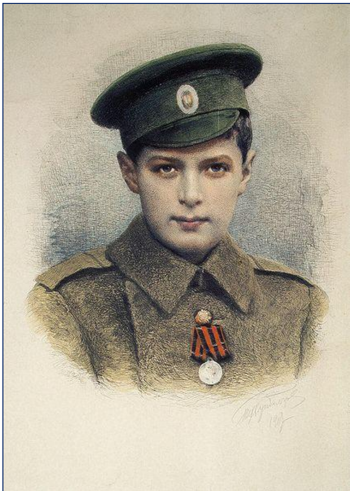
Сын Николая II- Цесаревич и Великий князь Алексей Николаевич. (1904-1918 гг.)

Общество ожидало от нового царя реформ, однако в своей первой публичной речи император заявил, что будет охранять основы самодержавия твердо и неуклонно, как его «незабвенный покойный родитель».