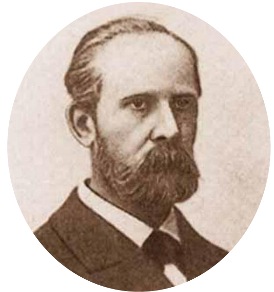
Министр просвещения Н. Боголепов.