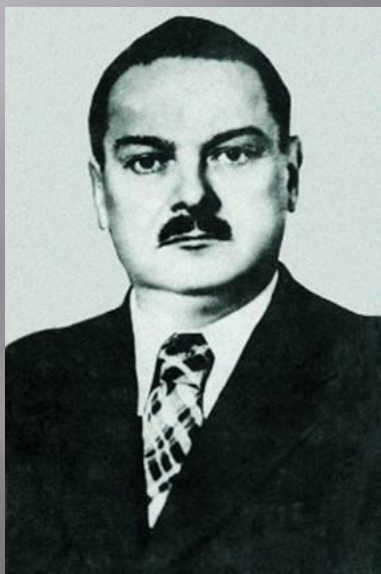
Секретарь ЦК ВКП (б) Жданов.

После войны продолжилось «Ленинградское дело». Были арестованы многие деятели и соратники бывшего секретаря ВКП(б) Жданова. Число арестованных превысило 2000 человек. 200 из них было расстреляно, в том числе Председатель Совмина РСФСР Родионов, член Политбюро и Председатель Госплана СССР Вознесенский и др.