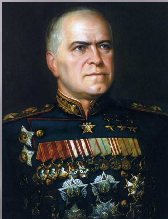
Маршал Советского Союза Г.К.Жуков.