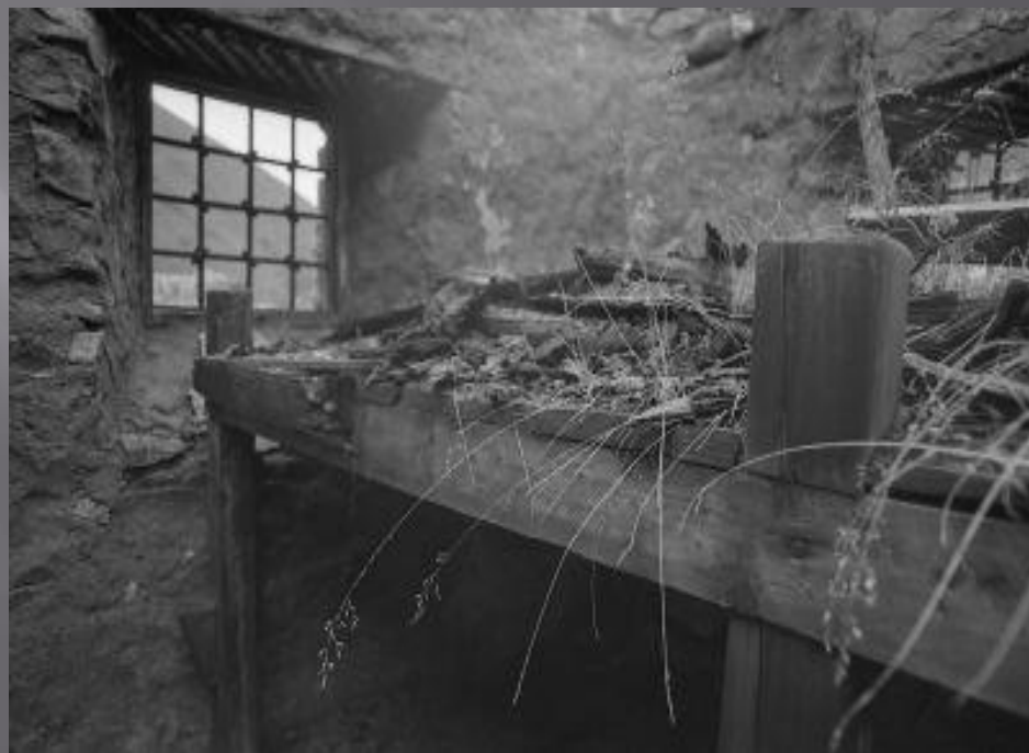
Нары в лагере