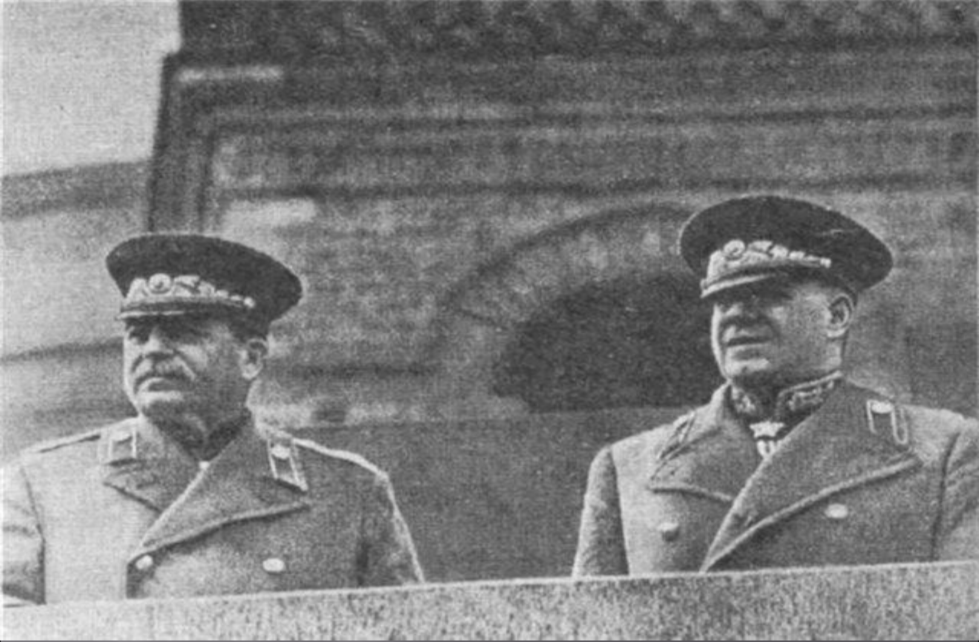
Сталин и Жуков на трибуне мавзолея Ленина в Москве.