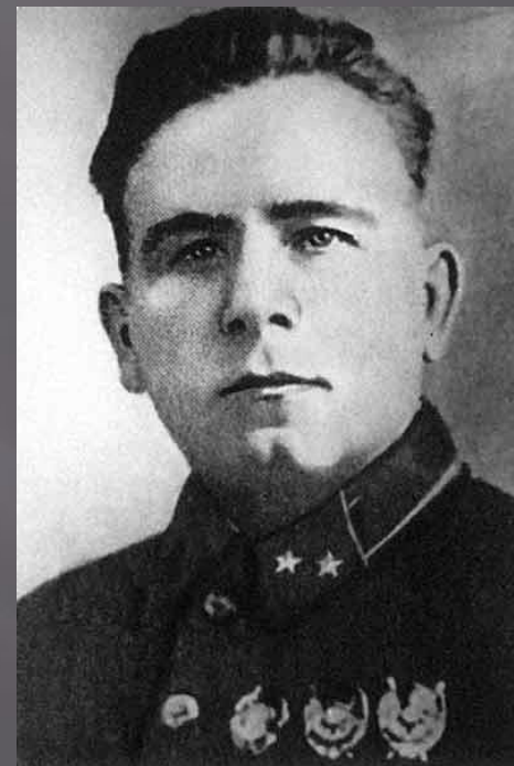
Генерал армии П. Понеделин.