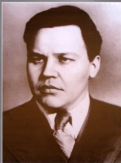
Председатель ГосПлана СССР Вознесенский