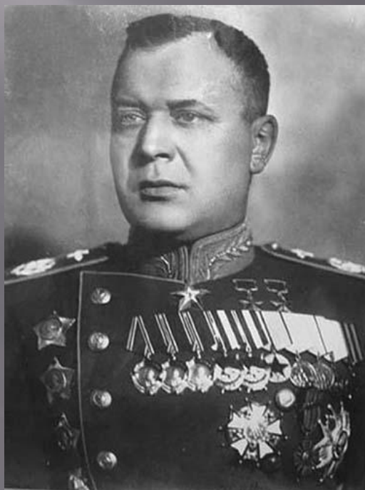
Маршал авиации А. Новиков