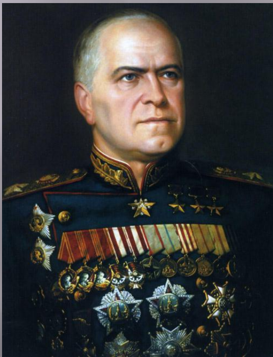
Маршал Советского Союза Г.К.Жуков.