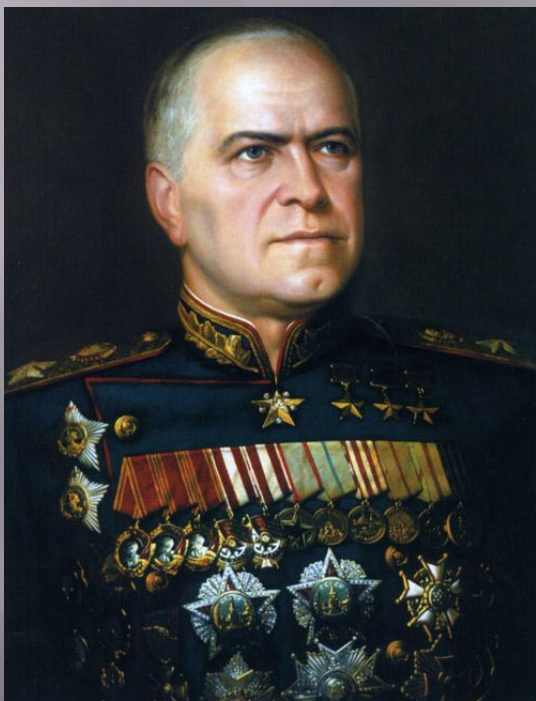
Маршал Советского Союза Г.К.Жуков.

В стране была невероятной популярностью военных, опасаясь этого Сталин начал новые репрессии против армии. Арестованы были маршал авиации Новиков, генералы Понеделин, Кириллов. Сам Жуков был обвинен в неуважении к Сталину и высокомерию.