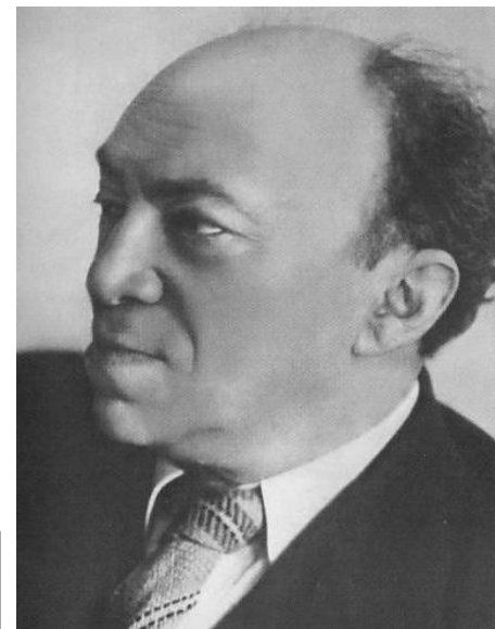
Соломон Михоэлс, председатель АЕК, актер, убит в 1948 г.

В мае-июле 1952 г. состоялся закрытый судебный процесс, приговоривший лидеров комитета к расстрелу