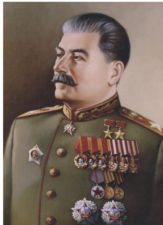
Генералиссимус И.В. Сталин

2. по пути усиления борьбы с «вольнодумством» и укрепления режима