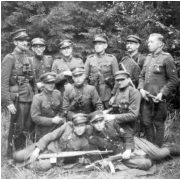
Литовские «лесные братья»

За участие в них только в Западной Украине к 1950 г. было депортировано, сослано или арестовано около 300 тыс. человек