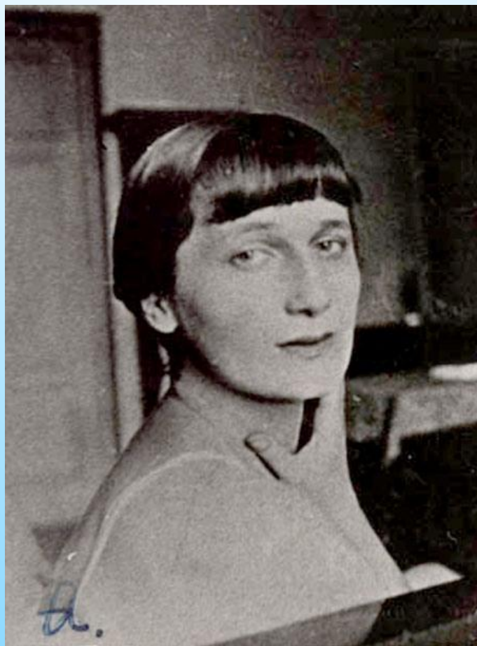
Ахматова Анна Андреевна

«...две России глянули друг другу в глаза : та, что сажала, и та, которую посадили».