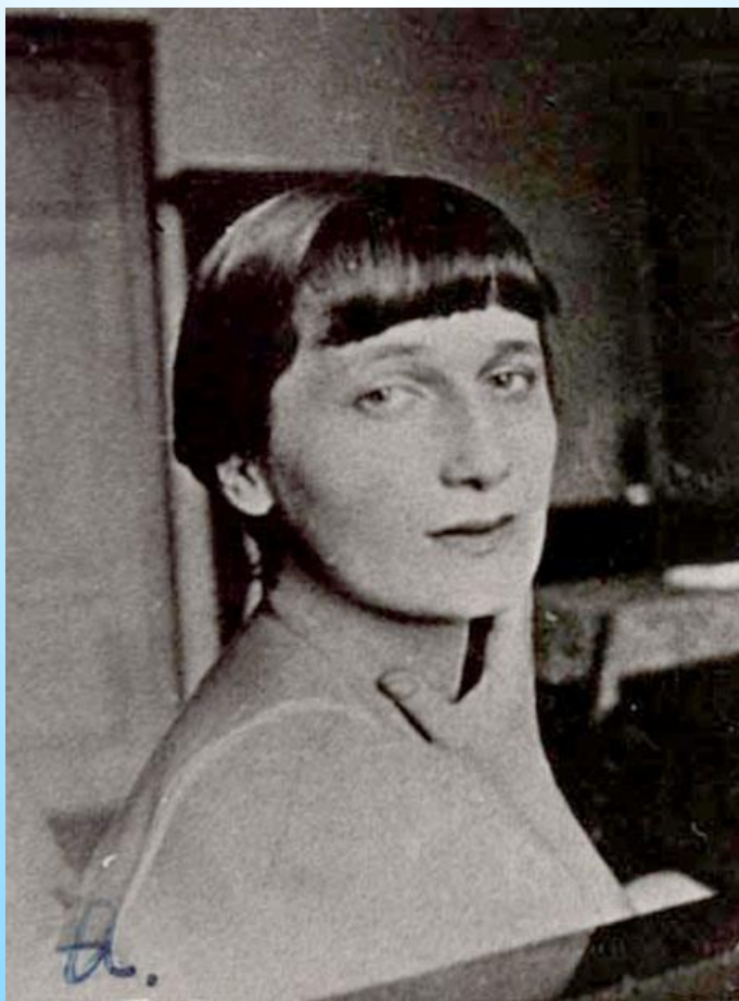
Ахматова Анна Андреевна

«...две России глянули друг другу в глаза : та, что сажала, и та, которую посадили».