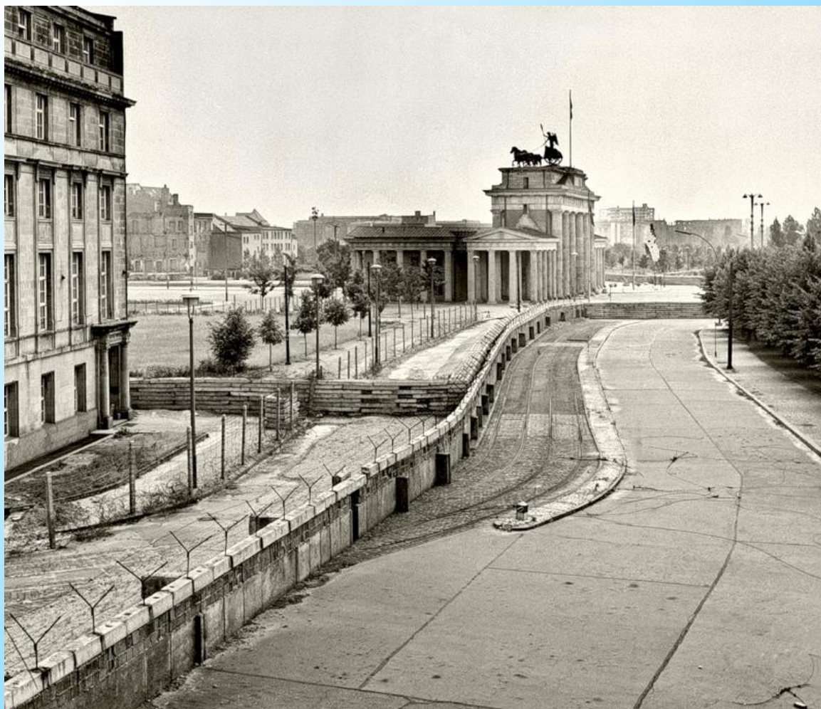
Берлинская стена - сооружение, возведенное в августе 1961