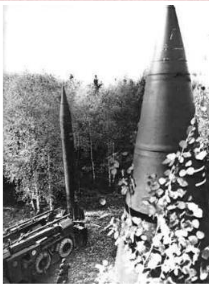
Ракеты средней дальности.

В сер.60-х гг.руководство страны поставило задачу достичь военно-стратегического паритета с США.На вооружение начала поступать новейшие техника и ядерное оружие.Роль Генералитета и руководства ВПК резко выросла.В 1976 г. Министром обороны стал член Политбюро Д. Ф. Устинов,возглавлявший долгие годы различные отрасли военного производства.