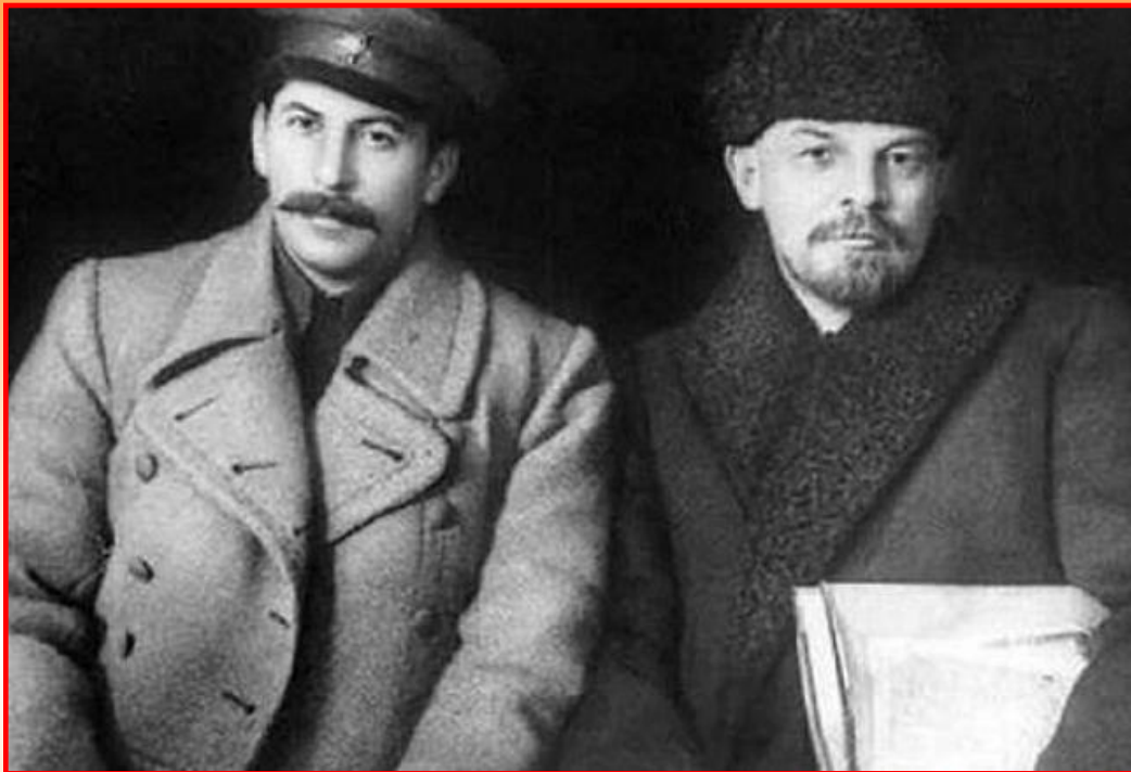
Сталин и Ленин

5. Сталин объявил, что материальное положение народа не улучшается по вине «внутренних» и «внешних» врагов;