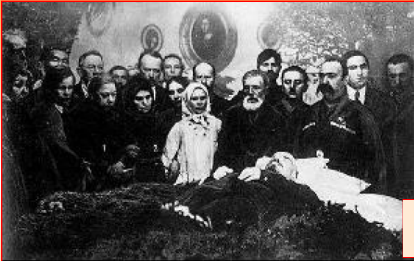
Тело Ленина в Горках

В 1920-е годы политический режим ужесточился, сложилась однопартийная система. После смерти Ленина разгорелась ожесточенная борьба за власть в партийном руководстве. Победителем в этой борьбе стал генеральный секретарь ЦК ВКП(б) И.В.Сталин.