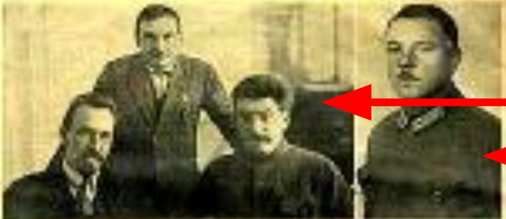
А.Рыков, И.Сталин (сидят)