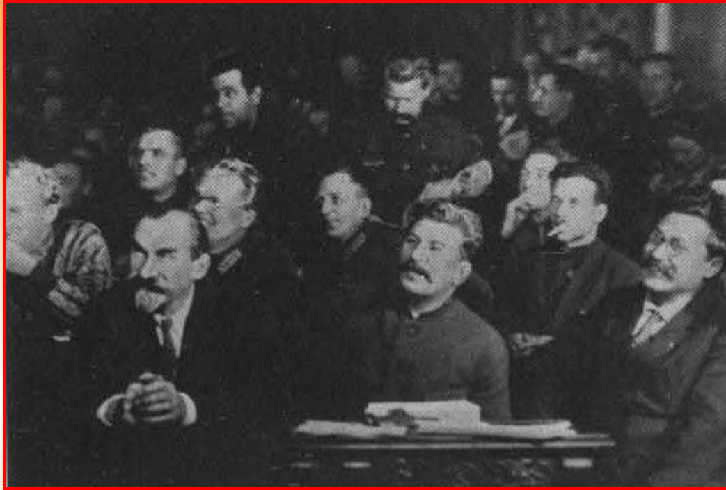
XV конференция ВКП(б)

Сталин высказал идею о возможности построения социализма в «одной, отдельно взятой стране» и подверг критике Троцкого и его сторонников за неверие в успех построения социализма в СССР. XV партийная конференция в 1926 г. утвердила этот сталинский тезис в качестве основного партийного принципа.