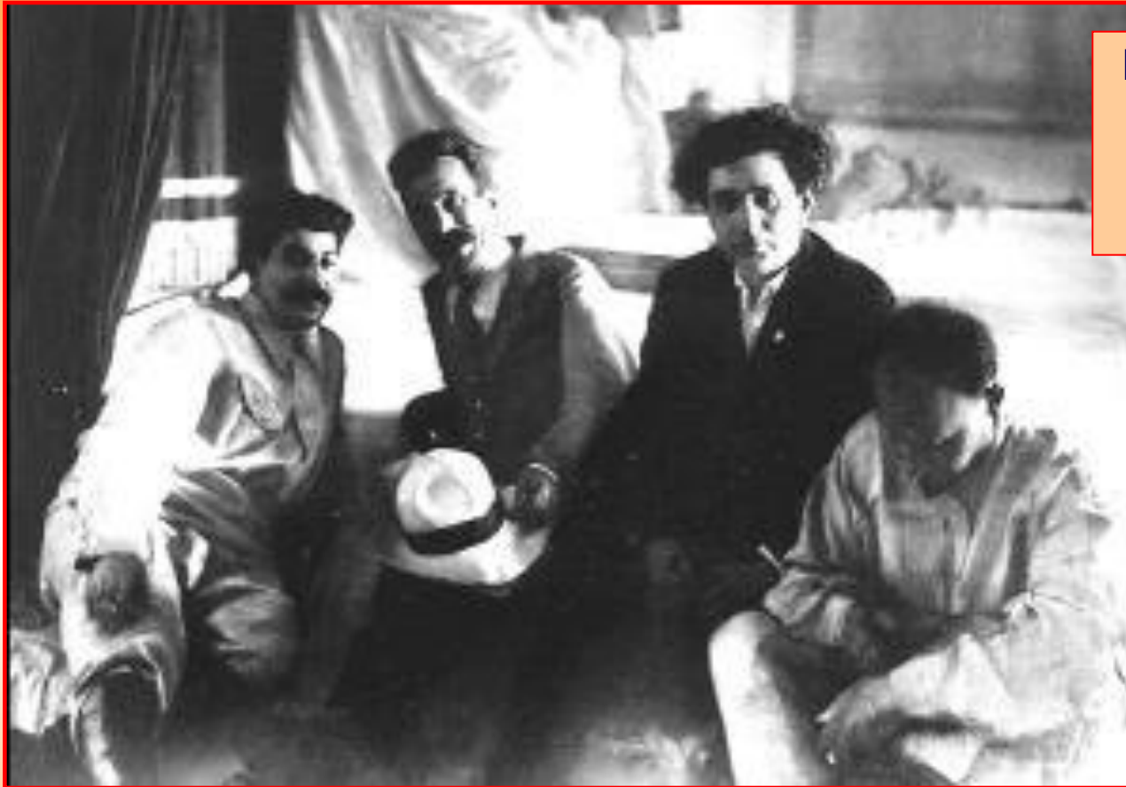
И.Сталин, А. Рыков Г.Зиновьев, Н.Бухарин

В 1927 г. за попытку организации демонстрации Г. Зиновьев, Л.Каменев и Л.Троцкий были исключены из партии. В начале 1928 г. Троцкого и его соратников выслали в Алма-Ату, а затем выдворили за пределы СССР.