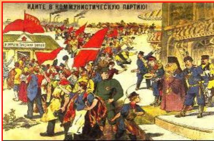
Идите в компартию! Плакат 1923 г.

В годы войны РКП(б) фактически стала подменять госаппарат. Важнейшие решения принимались на созданном в 1919 г. Политбюро. Все его члены занимали и важнейшие государственные посты. Компартия превратилась в жестко централизованную организацию. Против подобной ситуации выступила «рабочая оппозиция» во главе с А. Шляпниковым. Она обвинила партийную верхушку в перерождении.