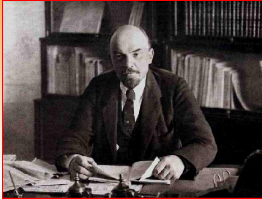
Ленин в рабочем кабинете в кремле

Между нэповской экономической и политической системами сложилось глубокое противоречие. В экономике прошла либерализация, а в политике ряд социальных групп был лишен возможности отстаивать свои интересы. Это противоречие сглаживалось Лениным, который пользовался большим авторитетом у большинства населения. В 1922 г. Ленин тяжело заболел. В этот период заседания Политбюро поручили вести И.В.Сталину. Для него создали должность генерального секретаря.