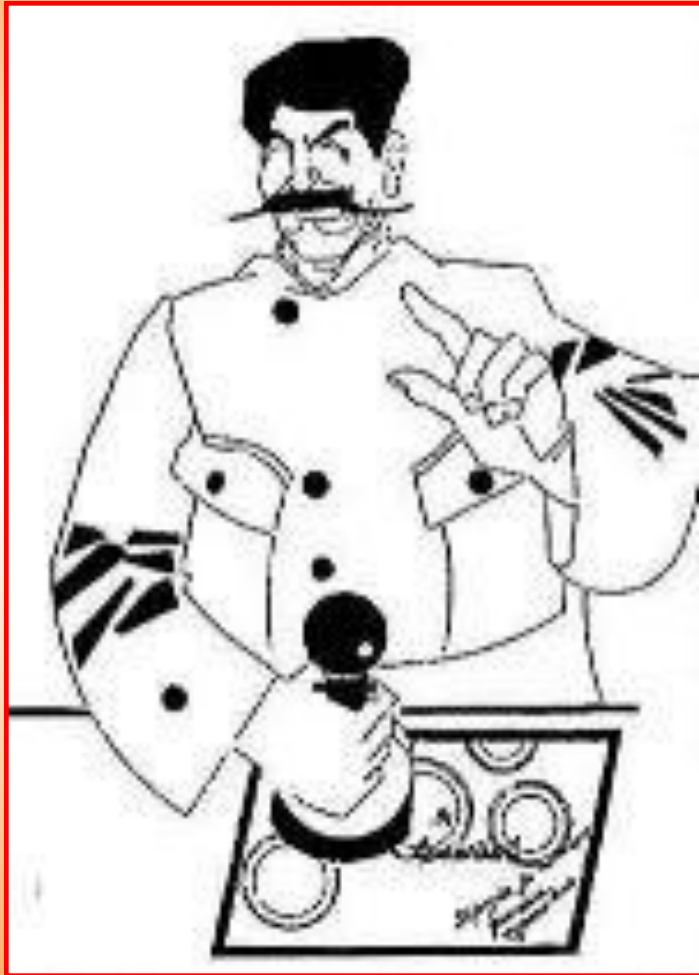
Д.Моор. Никаких меньшевиков (1922 г.)

В 1923 г. ЦК РКП(б) была разработана секретная инструкция «О мерах борьбы с меньшевиками», ставившая задачу уничтожить меньшевиков и дискредитировать их перед рабочим классом. Хотя от идеи открытого судебного процесса над меньшевиками решено было отказаться, в 1923 г. начался распад меньшевистской партии. Таким образом в стране утвердилась однопартийная система.