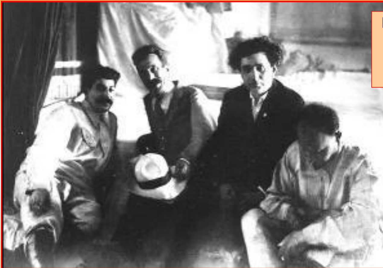
И.Сталин, А. Рыков Г.Зиновьев, Н.Бухарин

В 1927 г. за попытку организации демонстрации Г. Зиновьев, Л.Каменев и Л.Троцкий были исключены из партии. В начале 1928 г. Троцкого и его соратников выслали в Алма-Ату, а затем выдворили за пределы СССР.