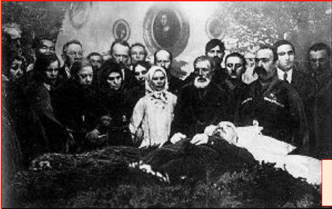
Тело Ленина в Горках

В 1920-е годы политический режим ужесточился, сложилась однопартийная система. После смерти Ленина разгорелась ожесточенная борьба за власть в партийном руководстве. Победителем в этой борьбе стал генеральный секретарь ЦК ВКП(б) И.В.Сталин.