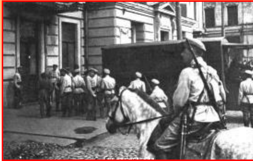
Суд над эсерами

Добившись единства в своих рядах, руководство партии приступило к ликвидации оппонентов из других партий. Летом 1922 г. прошел открытый судебный процесс над эсерами, обвинявшимися в сговоре с белогвардейцами и проведении контрреволюционной пропаганды. 12 человек были приговорены к смертной казни, которая была отложена и поставлена в зависимость от «поведения» остальных эсеров оставшихся на воле.