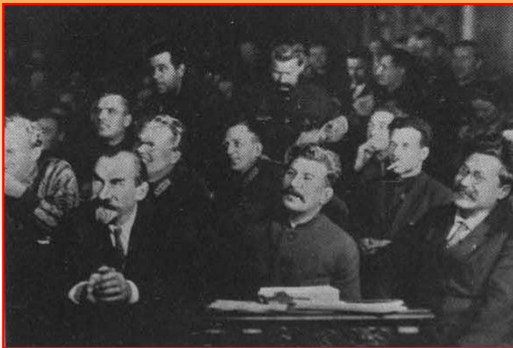
XV конференция ВКП(б)

Сталин высказал идею о возможности построения социализма в «одной, отдельно взятой стране» и подверг критике Троцкого и его сторонников за неверие в успех построения социализма в СССР. XV партийная конференция в 1926 г. утвердила этот сталинский тезис в качестве основного партийного принципа.