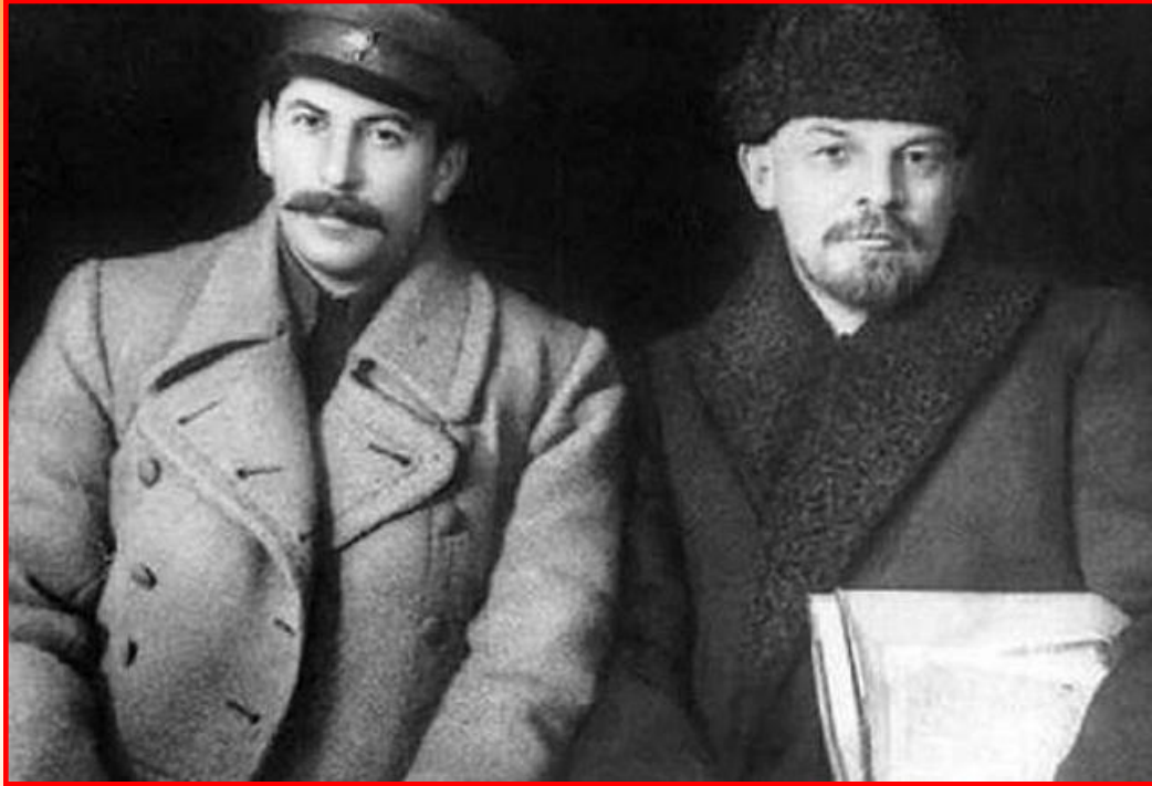
Сталин и Ленин

5. Сталин объявил, что материальное положение народа не улучшается по вине «внутренних» и «внешних» врагов;