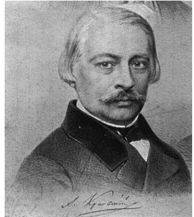
А. А. Краевский, гравированный портрет В. Ф. Тимма из «Русского художественного листка»

«Голос» А.А. Краевского «Отечественные записки М.Е. Салтыкова-Щедрина