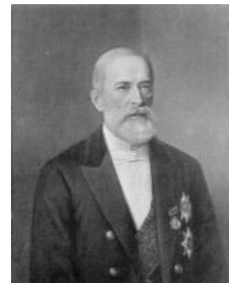
Бунге Н.Х. министр финансов