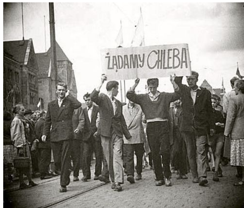
Демонстрация в Познани 1956 г.

демократические процессы в Венгрии , где под влиянием решений XX съезда КПСС шла активная критика старого руководства Венгерской партии трудящихся и просоветской ориентации страны