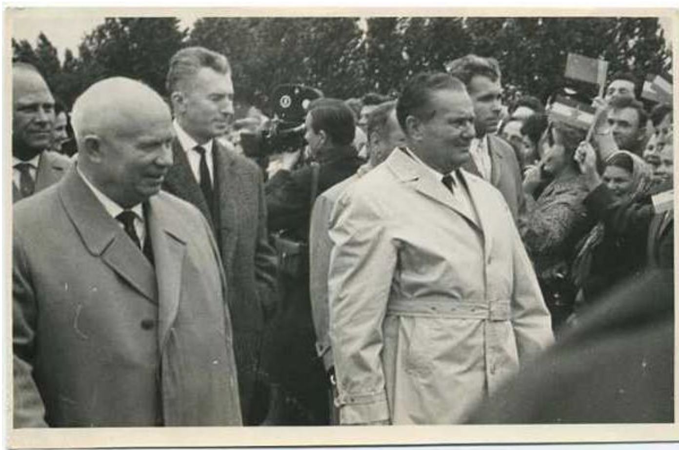
Н.С. Хрущев и лидер Югославии Иосип Броз Тито

В 1955 г. по инициативе советского руководства были нормализованы советско-югославские отношения.