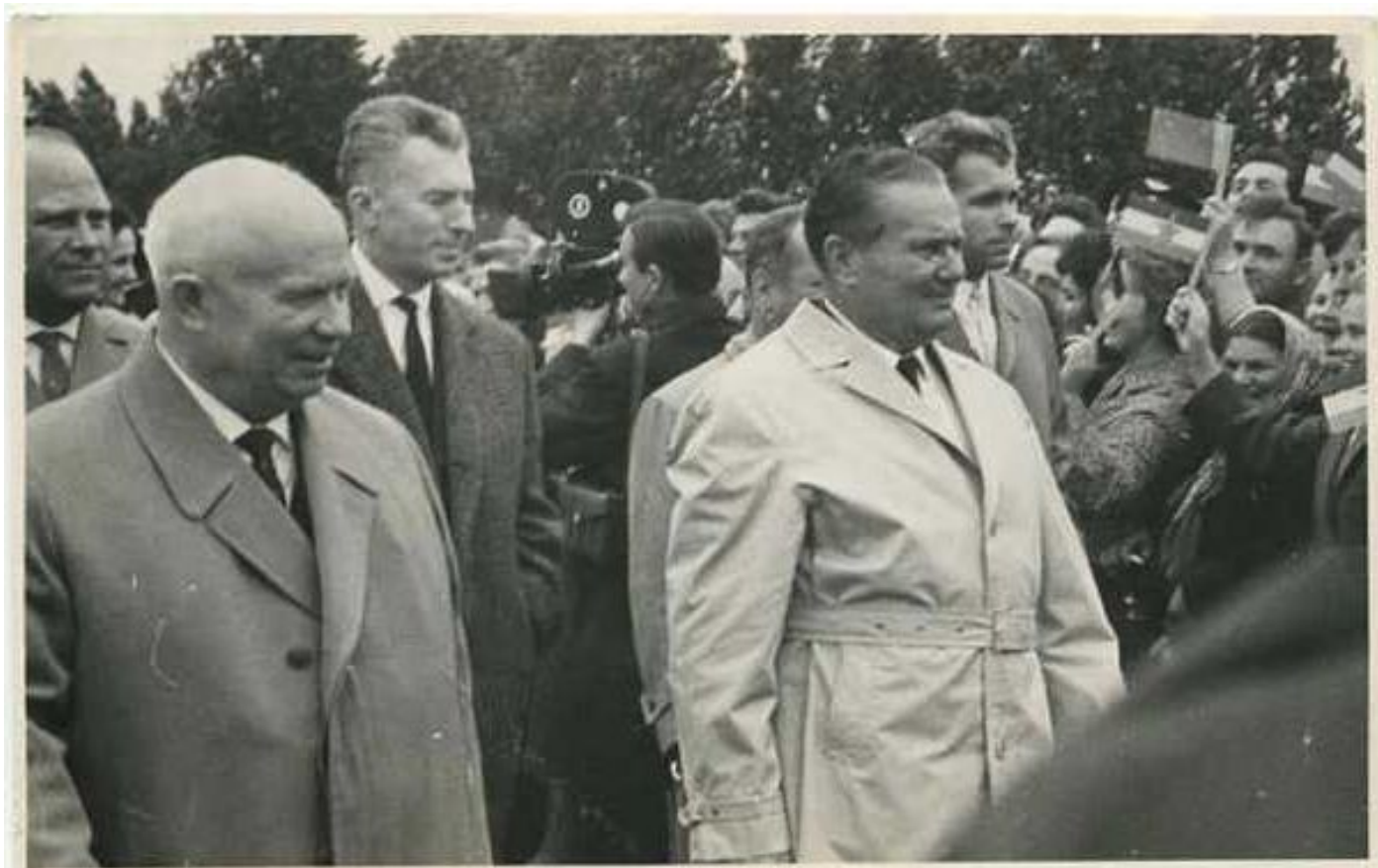
Н.С. Хрущев и лидер Югославии Иосип Броз Тито

В 1955 г. по инициативе советского руководства были нормализованы советско-югославские отношения.