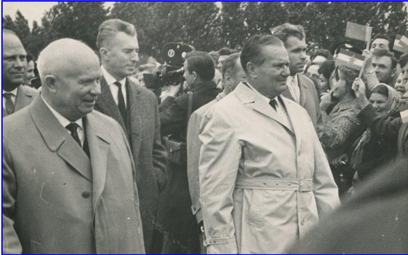
Н.Хрущев и И.Тито

Важнейшим направлением внешней политики была поддержка союзных социалистических государств в Восточной Европе, Азии, а затем и на Кубе. В 1955 г. по инициативе СССР были нормализованы советско-югославские отношения.