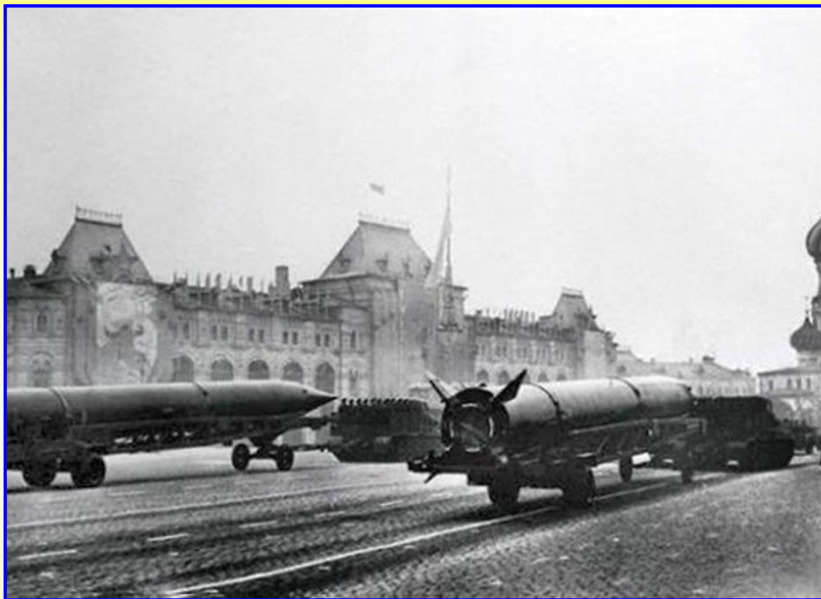
Ракеты с ядерными зарядами на параде на Красной площади

В 1957 г. в СССР прошли первые в мире успешные испытания межконтинентальной баллистической ракеты. Теперь территория США уже не была недосягаема для советских ядерных боеголовок. СССР начал вести переговоры с США с позиции силы.