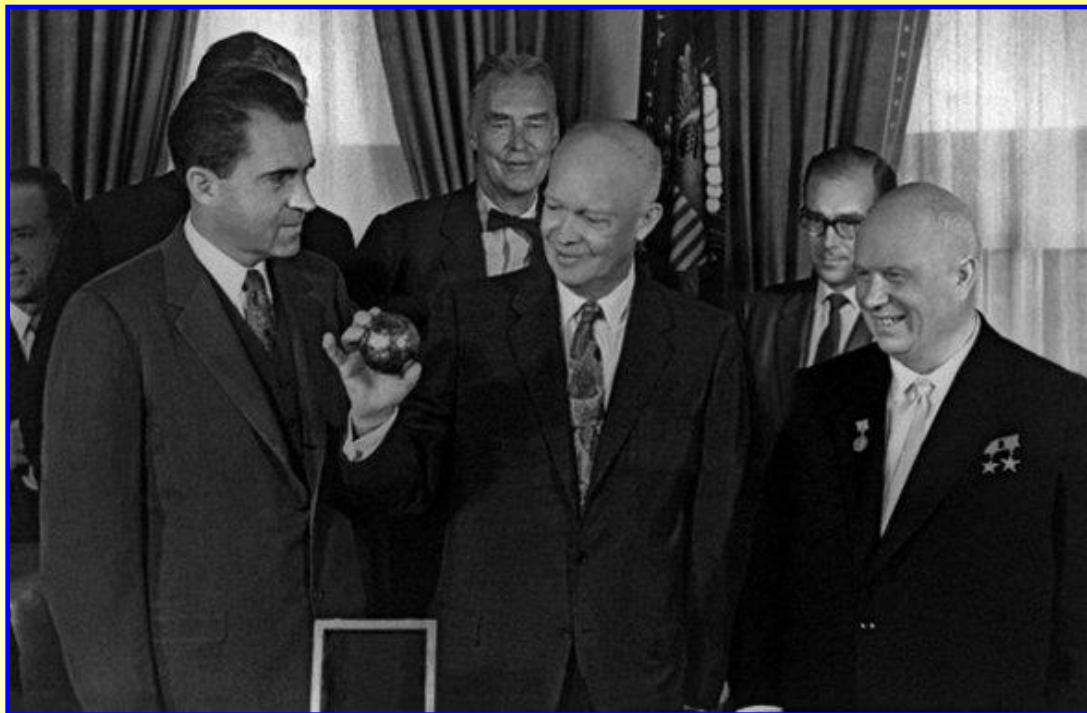
Н.Хрущев и президент США Эйзенхауэр

Не смотря на мирные заверения между руководством СССР и США существовало взаимное недоверие, отсутствовали средства контроля за ядерным потенциалом противника. В 1956 г. Н.Хрущев заявил об изменении военной доктрины СССР от массового применения войск на поле боя к ракетно-ядерному противостоянию.