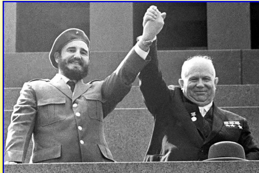
Н.Хрущев и Ф. Кастро