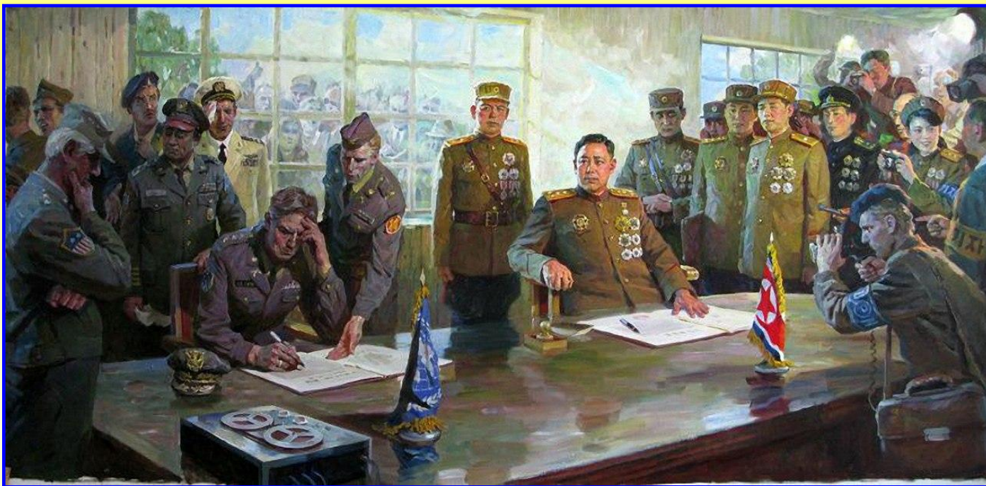
Подписание перемирия в Корее

В 1953 г. СССР добился компромисса с США, его результатом стало перемирие в Корее.