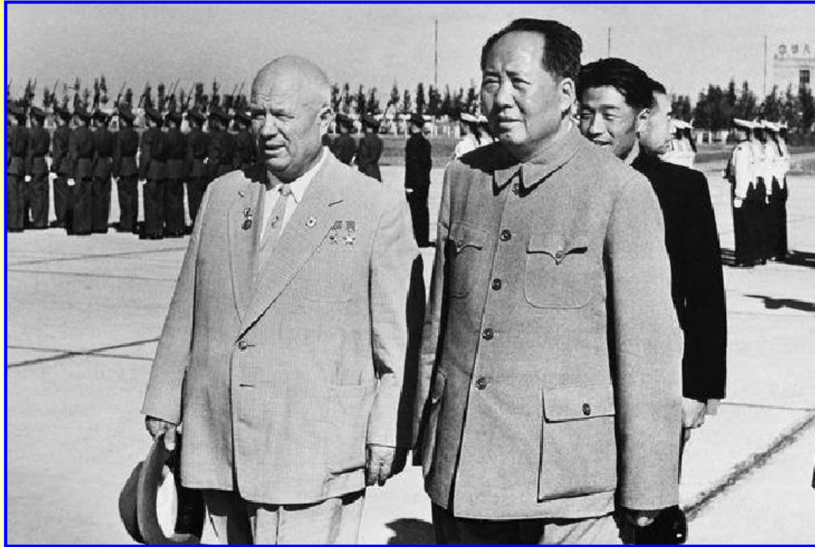
Н.Хрущев и Мао Дзэдун

Критика культа личности на XX съезде КПСС была болезненно воспринята руководством Китая, КНДР и Албании. Начался постепенный отход руководства этих стран от Москвы. Руководитель КНР Мао Дзэдун резко критиковал «советский ревизионизм», ставя его на одну доску с «американским империализмом».