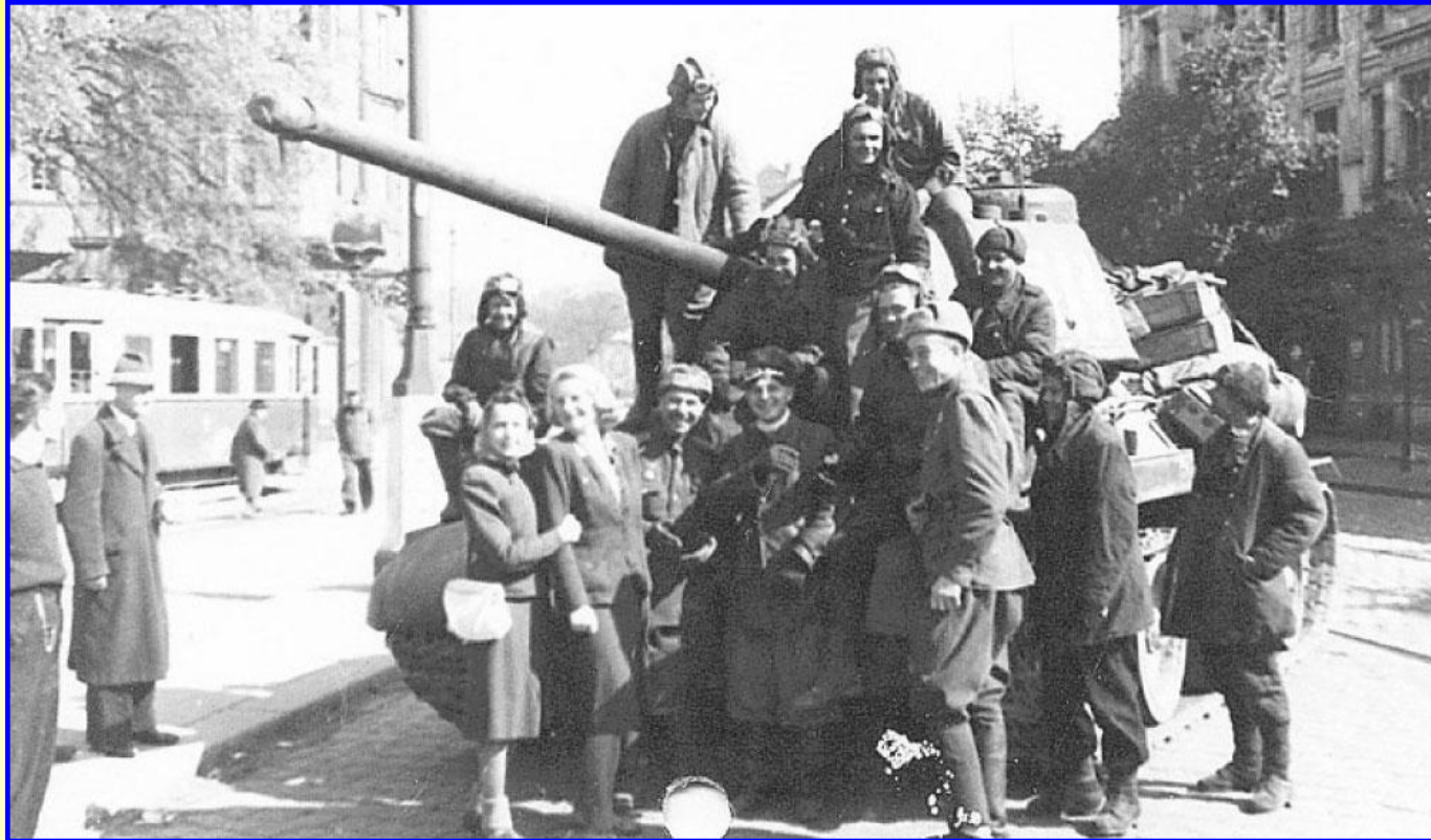
Освобождение Вены в апреле 1945 г.

В 1955 г. страны победительницы подписали договор с Австрией, по которому из страны были выведены советские войска.