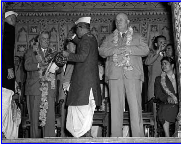
Н.Хрущев в Индии