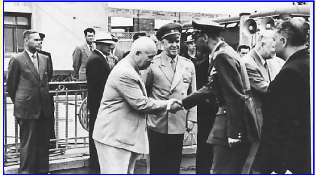
Н.Хрущев в Афганистане

После Второй мировой войны началось крушение колониальных империй. СССР прилагал значительные усилия для того, чтобы молодые независимые государства попали в сферу его влияния. В 1955 г. Хрущев и Булганин совершили длительные государственные визиты в Индию, Бирму и Афганистан.