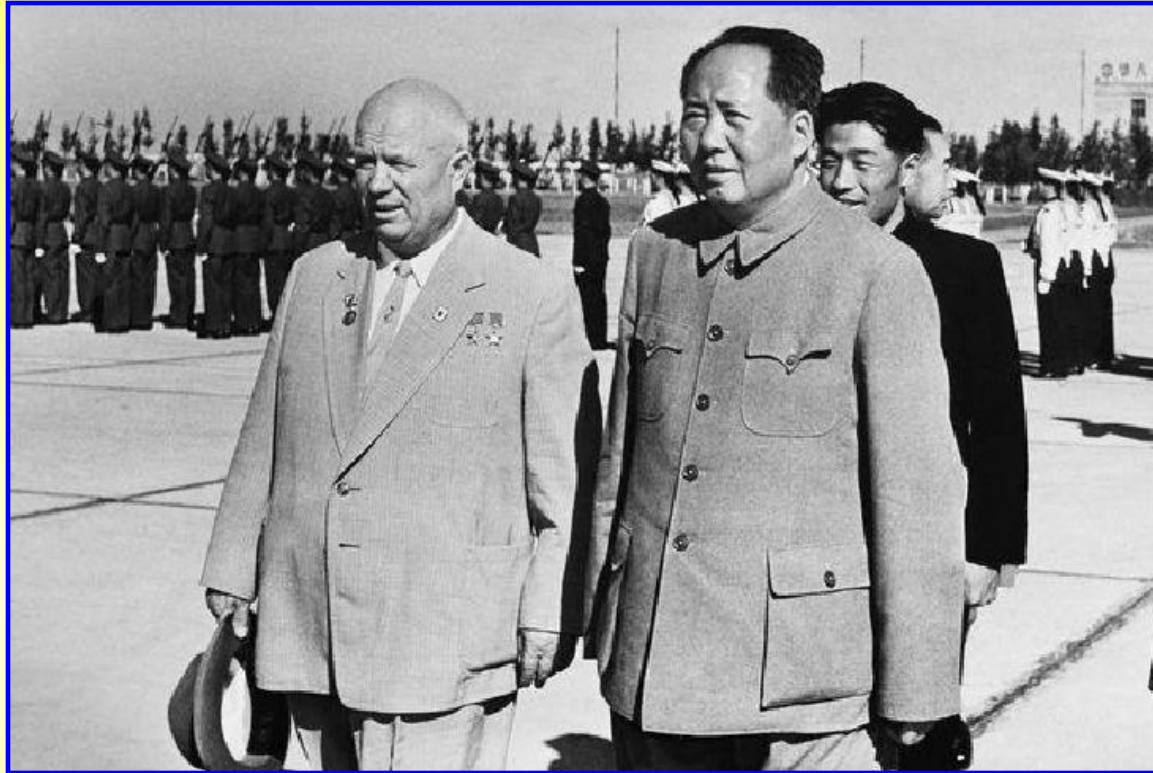
Н.Хрущев и Мао Дзэдун

Критика культа личности на XX съезде КПСС была болезненно воспринята руководством Китая, КНДР и Албании. Начался постепенный отход руководства этих стран от Москвы. Руководитель КНР Мао Дзэдун резко критиковал «советский ревизионизм», ставя его на одну доску с «американским империализмом».