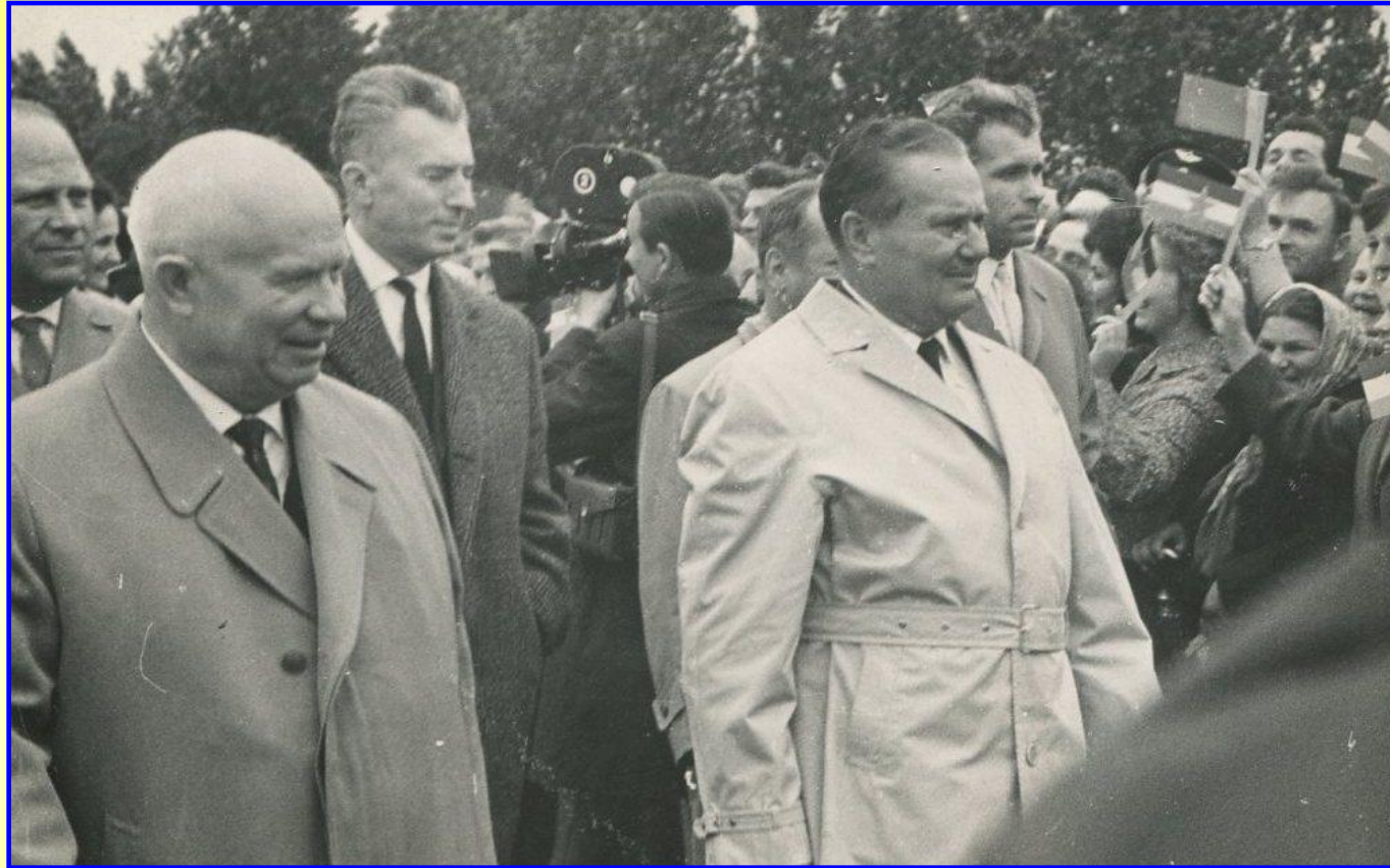
Н.Хрущев и И.Тито

Важнейшим направлением внешней политики была поддержка союзных социалистических государств в Восточной Европе, Азии, а затем и на Кубе. В 1955 г. по инициативе СССР были нормализованы советско-югославские отношения.