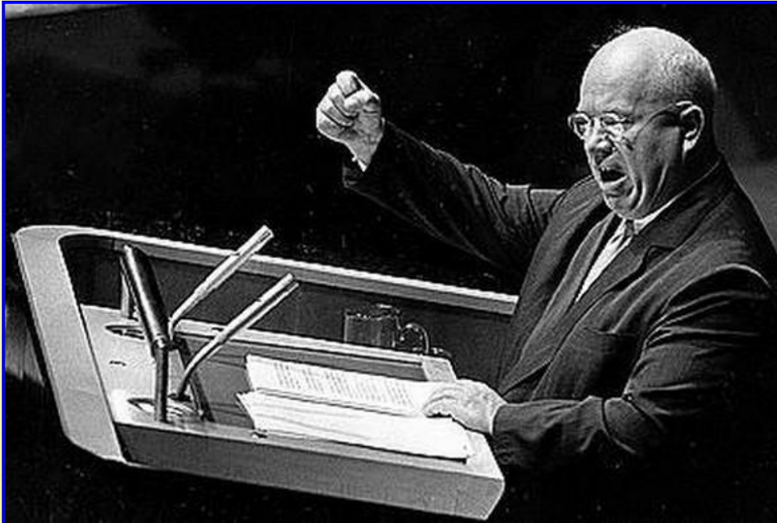
Н.С.Хрущев на трибуне ООН