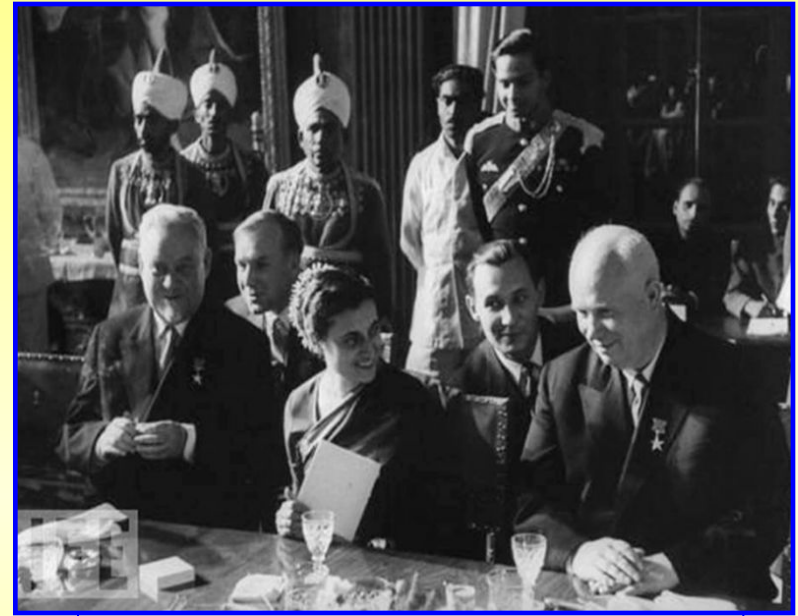
Н.Хрущев и И.Ганди

В 1957-1964 гг. состоялись переговоры с лидерами более чем 30 развивающихся стран, подписаны свыше 20 договоров о сотрудничестве. СССР пытался направить молодые государства по социалистическому пути, им выделялись кредиты, оказывалась военная помощь.