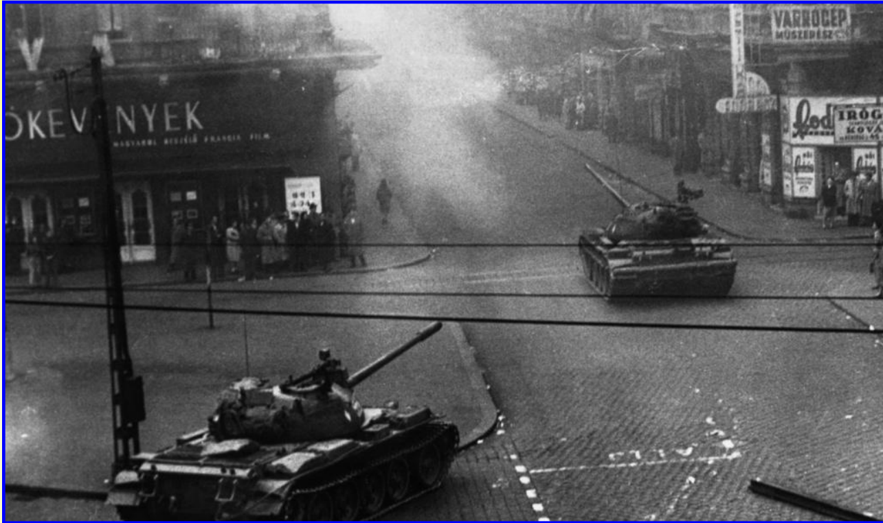
Советские танки на улицах Будапешта

В 1956 г. в Венгрии началось движение за обновление социализма. Активно критиковалась венгерская партия трудящихся и ее просоветская ориентация. СССР заявил, что это происки западных спецслужб и внутренних «врагов венгерского народа». СССР ввел в Венгрию свои войска и выступления были подавлены.