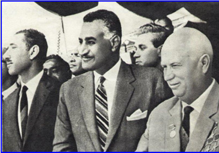
Н.Хрущев и Г.А.Насер