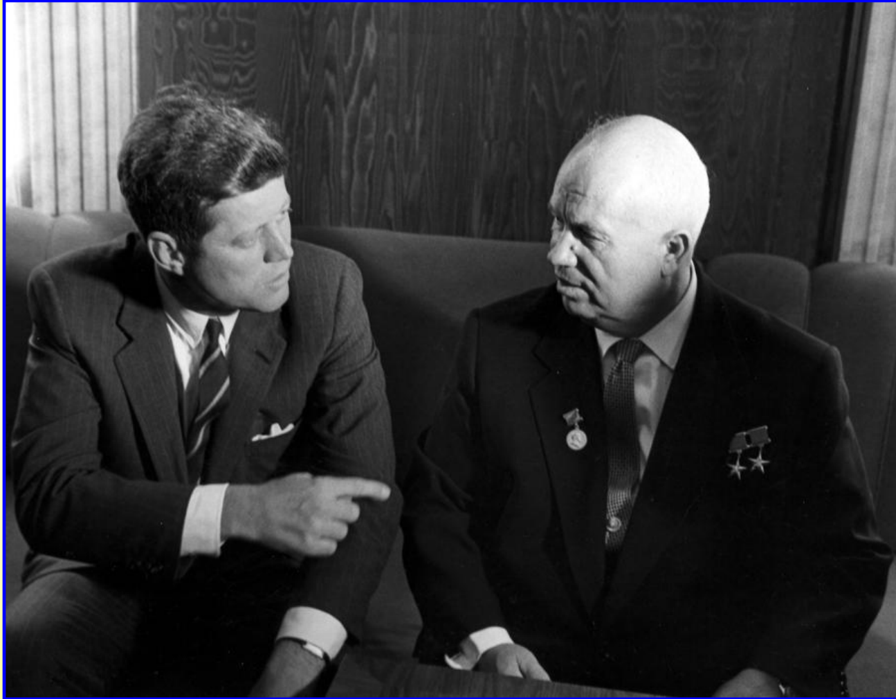
Н.Хрущев и президент США Дж. Кеннеди

Из-за жесткой позиции СССР были провалены переговоры Н.Хрущева с президентом США Дж. Кеннеди в Вене в 1961 г.