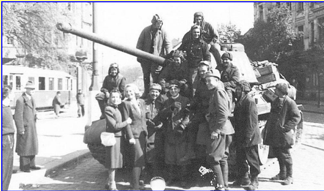
Освобождение Вены в апреле 1945 г.

В 1955 г. страны победительницы подписали договор с Австрией, по которому из страны были выведены советские войска.