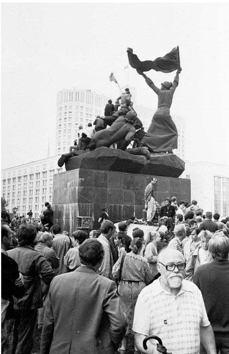
Защитники Белого Дома