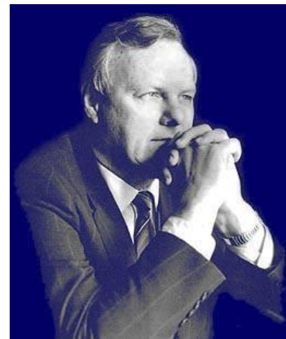
Экономист А. Собчак