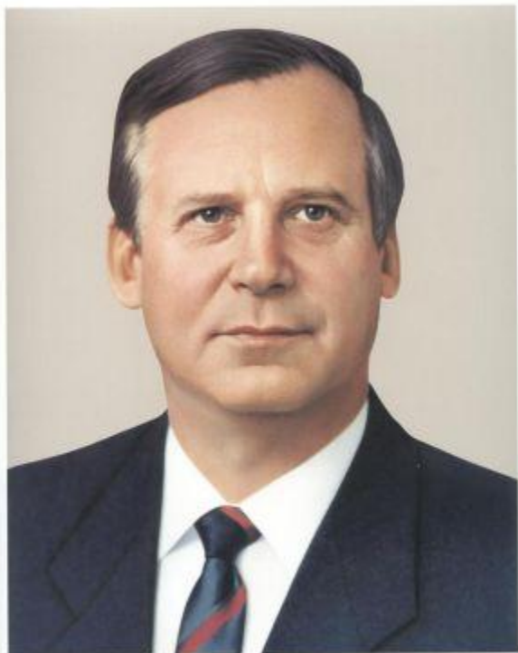
Николай Иванович РЫЖКОВ