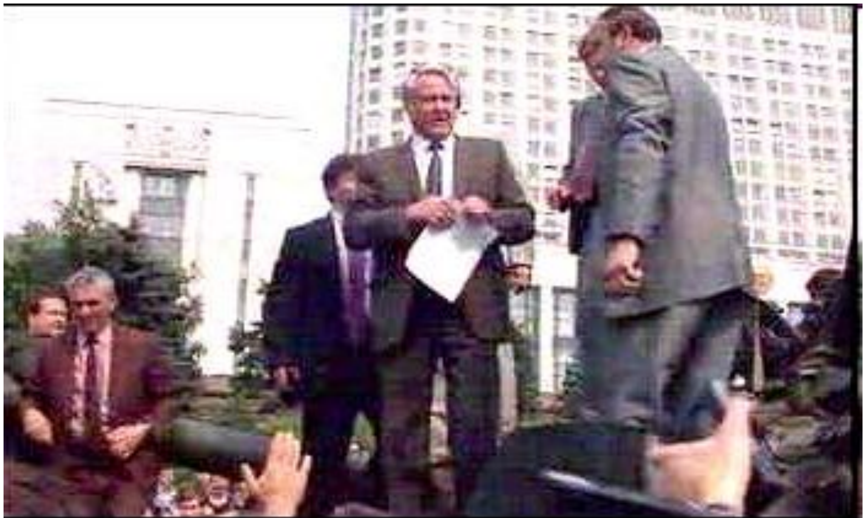
Б.Н. Ельцин на танке