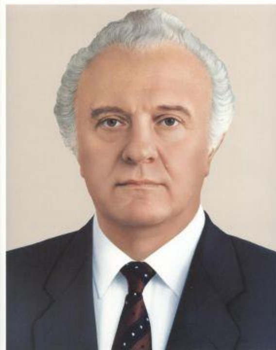
Эдуард Амирович ШЕВАРДНАДЗЕ