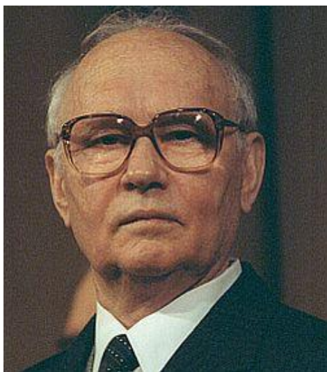
Председатель КГБ СССР В. А. Крючков