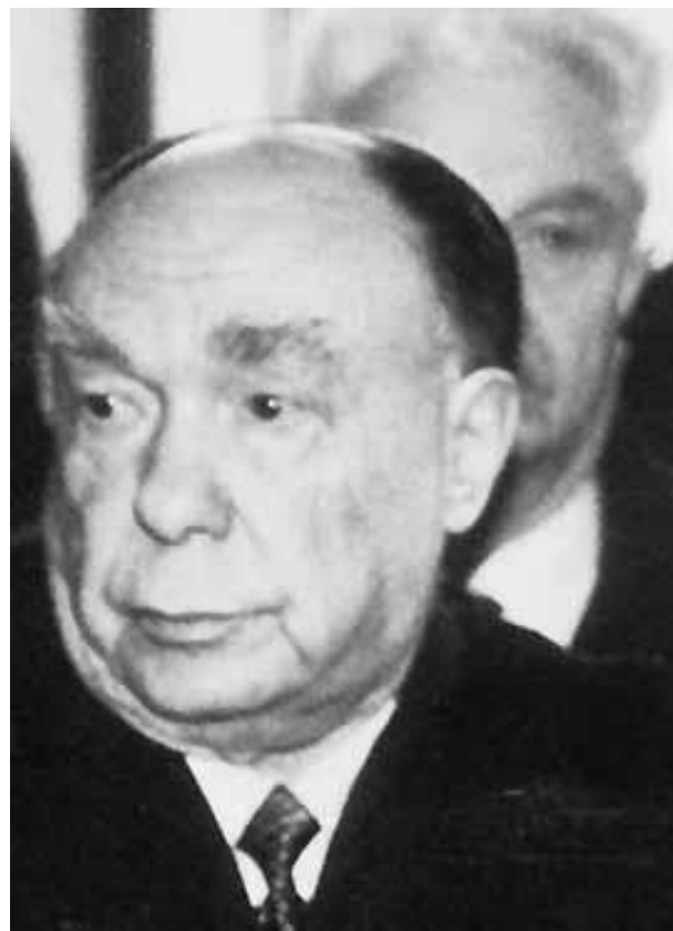
Заведующий отдела пропаганды ЦК КПСС