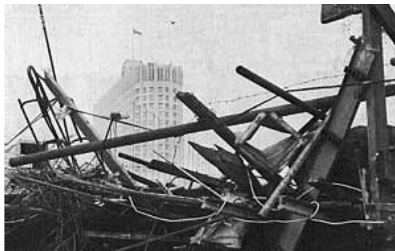
Баррикады у Белого Дома (здание Верховного Совета РСФСР)