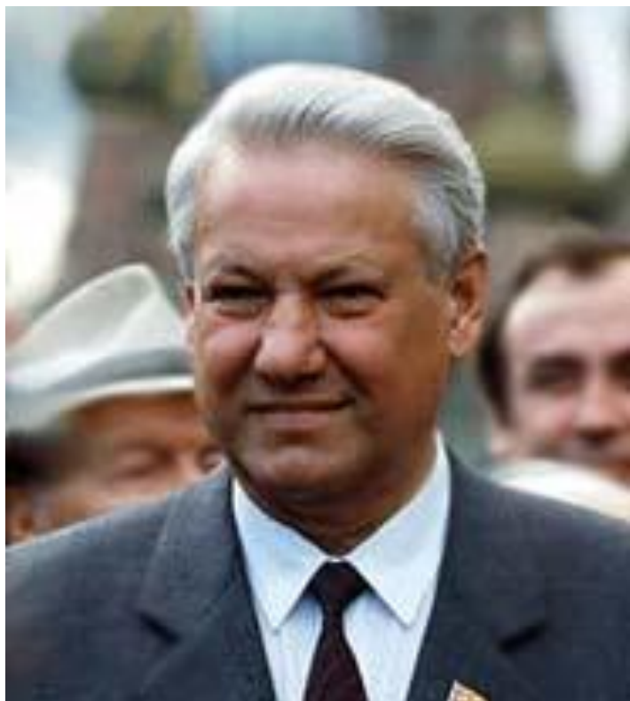
Секретарь Московского горкома КПСС