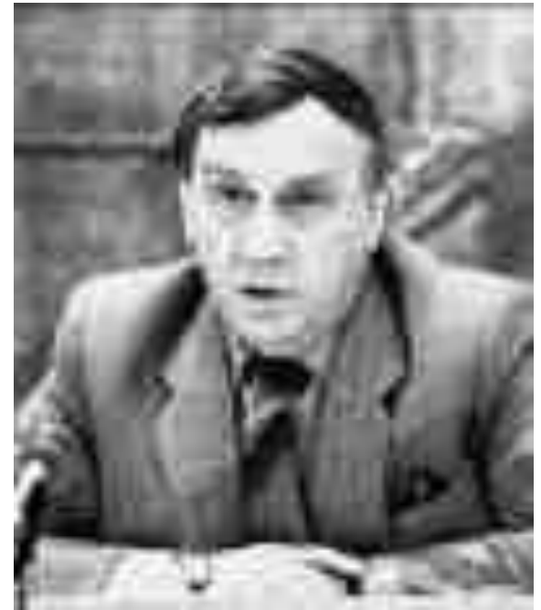
Г. И. Янаев