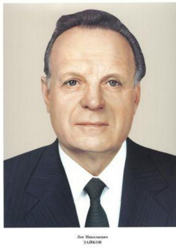
Секретарь ЦК КПСС