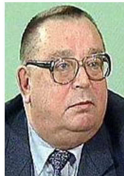
Премьер-министр СССР В. С. Павлов