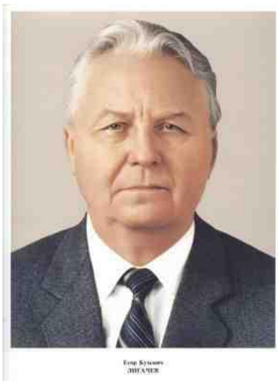
Член Политбюро ЦК КПСС