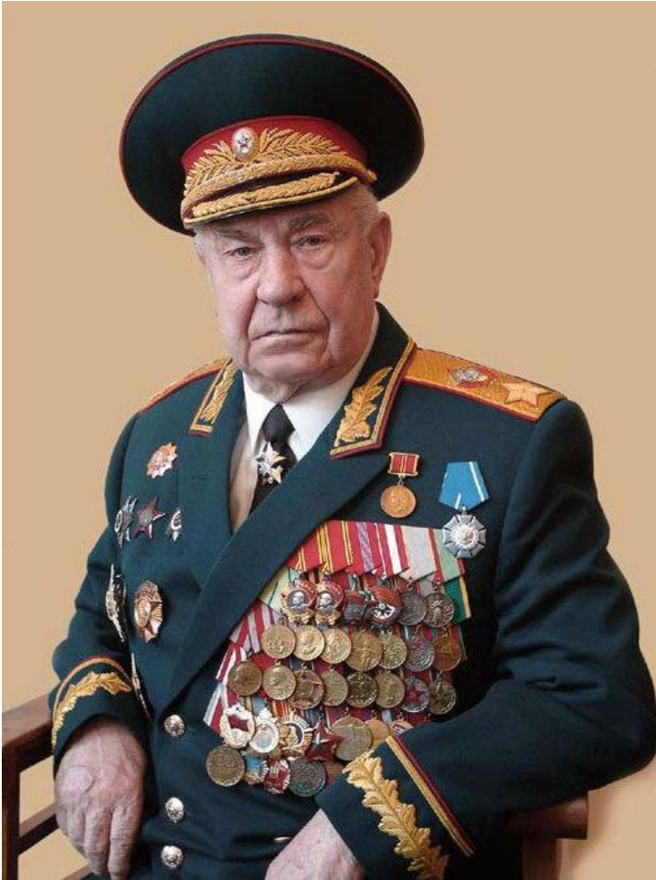
Министр обороны СССР Д. Т. Язов