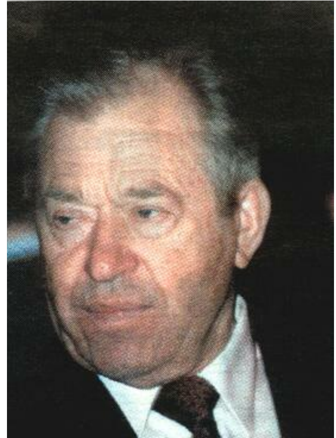
Председатель Крестьянского союза СССР В. А. Стародубцев