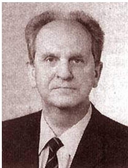
Министр внутренних дел СССР Б. К. Пуго