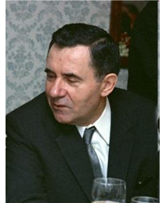
А.А. Громыко министр иностраннх дел (1957-1985)

«Разрядка международной напряжённости» - политика, направленная на снижение агрессивности противостояния стран социалистического и капиталистического лагерей