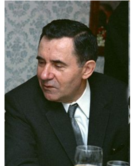
А.А. Громыко министр иностраннх дел (1957-1985)

«Разрядка международной напряжённости» - политика, направленная на снижение агрессивности противостояния стран социалистического и капиталистического лагерей