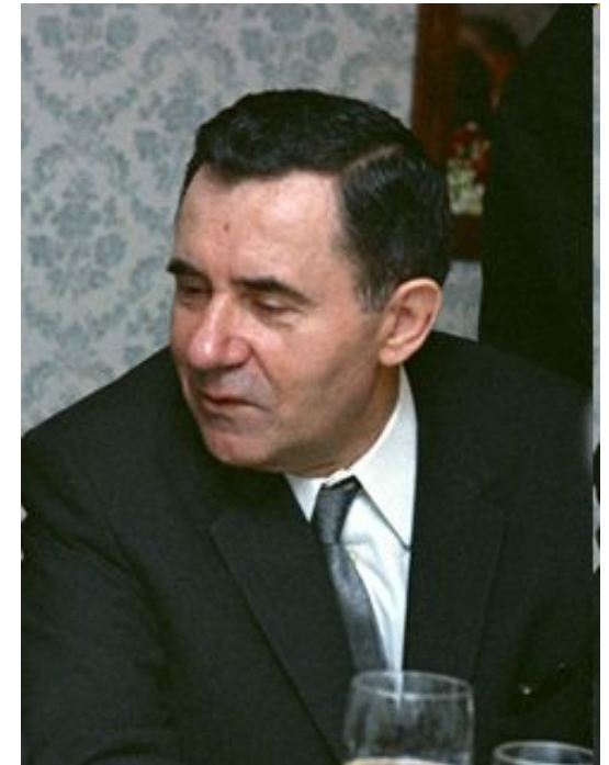
А.А. Громыко министр иностраннх дел (1957-1985)

«Разрядка международной напряжённости» - политика, направленная на снижение агрессивности противостояния стран социалистического и капиталистического лагерей