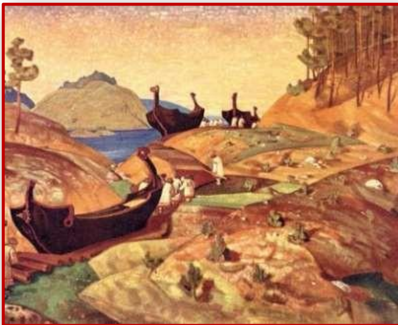
Волоком волокут. Худ. Н.Рерих Брячислав