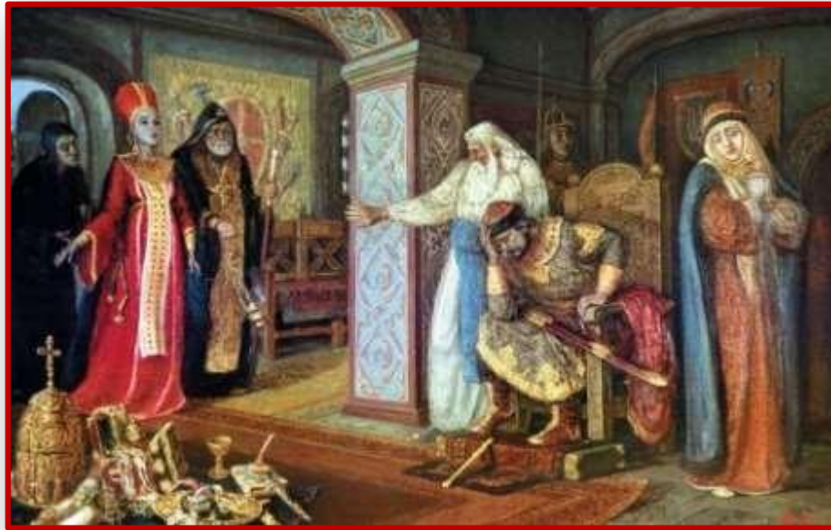
Рогволод и Рогнеда. Худ. Н.Дудченко Изяслав