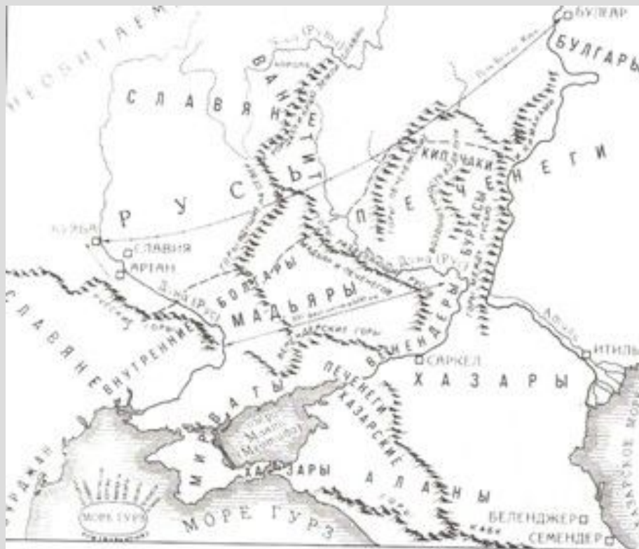
Племена Восточной Европы в первой половине IX в.

как государство Подонья и Приазовья, просуществовала с середины 7 века до 965 года. С приходом хазар племени, кочевавшие в донских степях, начинают вести оседлый образ жизни. Основными занятиями постепенно становятся земледелие и ремесленное производство. Значительное место в хозяйственной жизни занимало виноградоводство. В 834 году на берегу Дона была построена крепость Саркел. В 8 веке разные племена, населявшие донские степи, - аланы, болгары, угры, славяне, хазары, остатки готов, постоянно общаясь друг с другом, создали единую в основных своих чертах культуру.