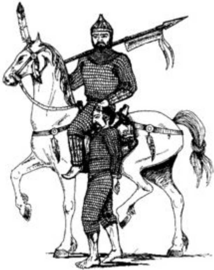
Хазарский воин с пленником.

Хазáры — тюркский кочевой народ. Стал известен в Восточном Предкавказье (равнинный Дагестан) вскоре после гуннского нашествия. До VII века хазары занимали подчинённое положение в сменявших друг друга кочевых империях. В 560-е гг. оказались в составе Тюркского каганата, после распада последнего в середине VII века создали собственное государство — Хазарский каганат (650—969), который стал одним из самых долговечных кочевых объединений в этом регионе.