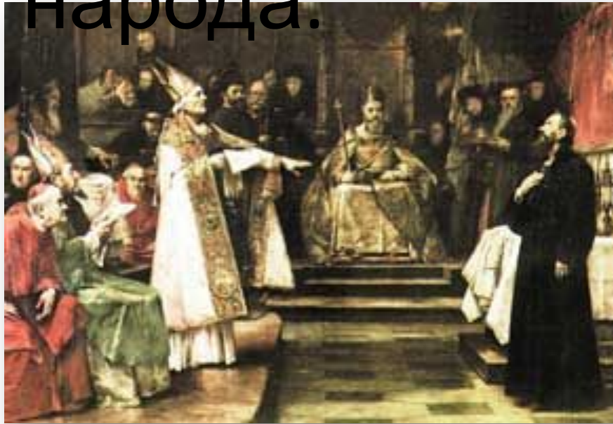
Собор в Констанце