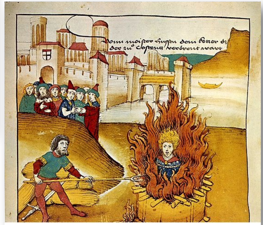
Сожжение Гуса. Миниатюра из хроники Шпицера