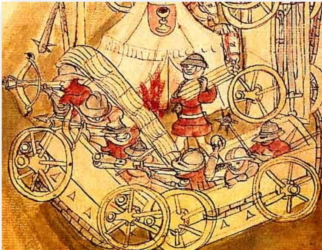
Укрепленный лагерь таборитов.