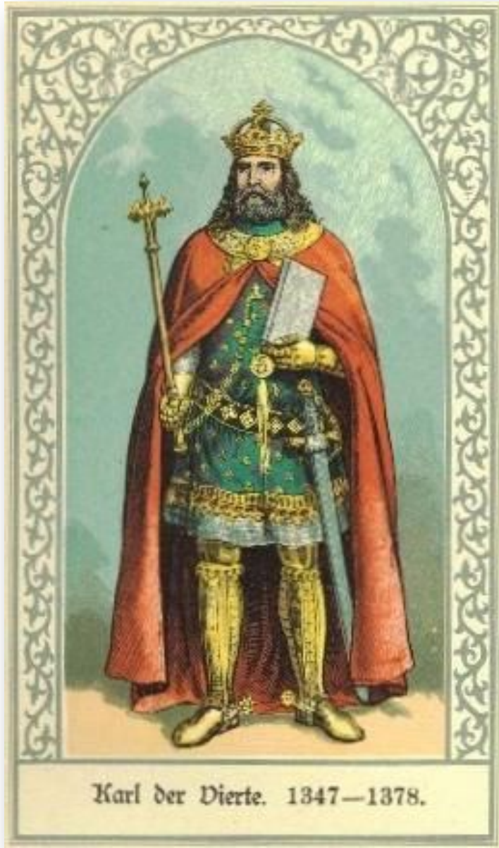
Karl der Vierte. 1347—1378.