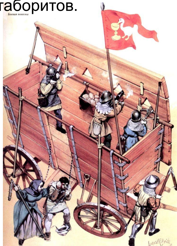
Боевая повозка таборитов.