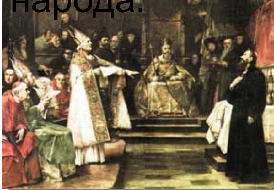
Собор в Констанце