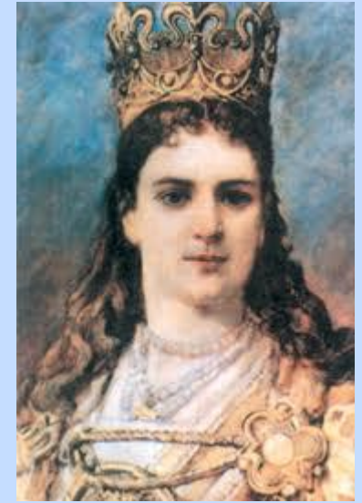
Польская королева Ядвига

Брачный союз скрепил Унию (договор) между Польшей и Литвой