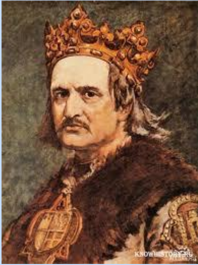
Литовский князь Ягайло

Литва принимает христианство, а потомки Ягайло получают польский престол.