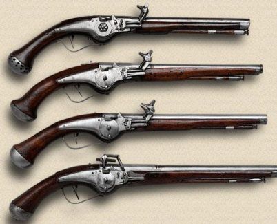
Кавалерийские колесцовые пистолеты