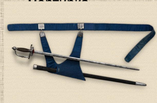
Шпага царя Петра I