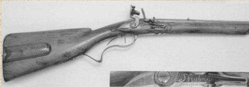
Мушкет и пистолет