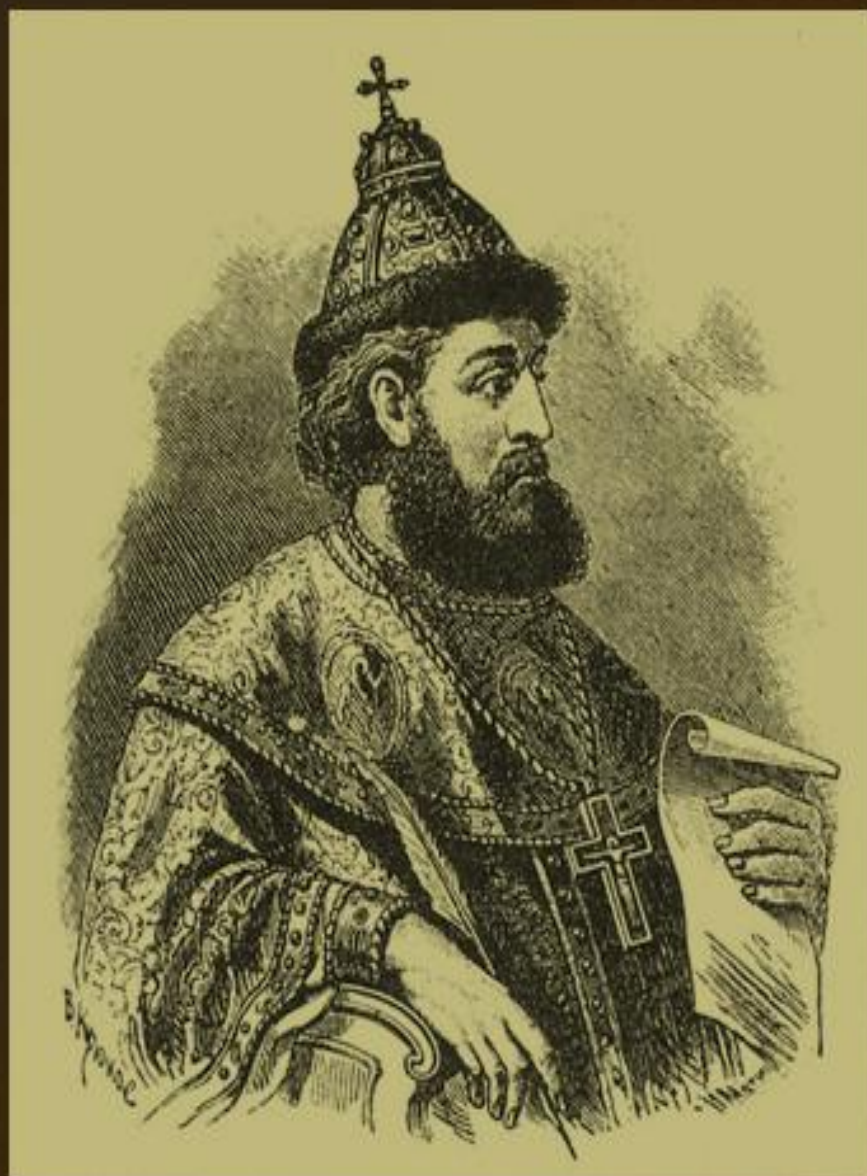
князь Володимир Мономах