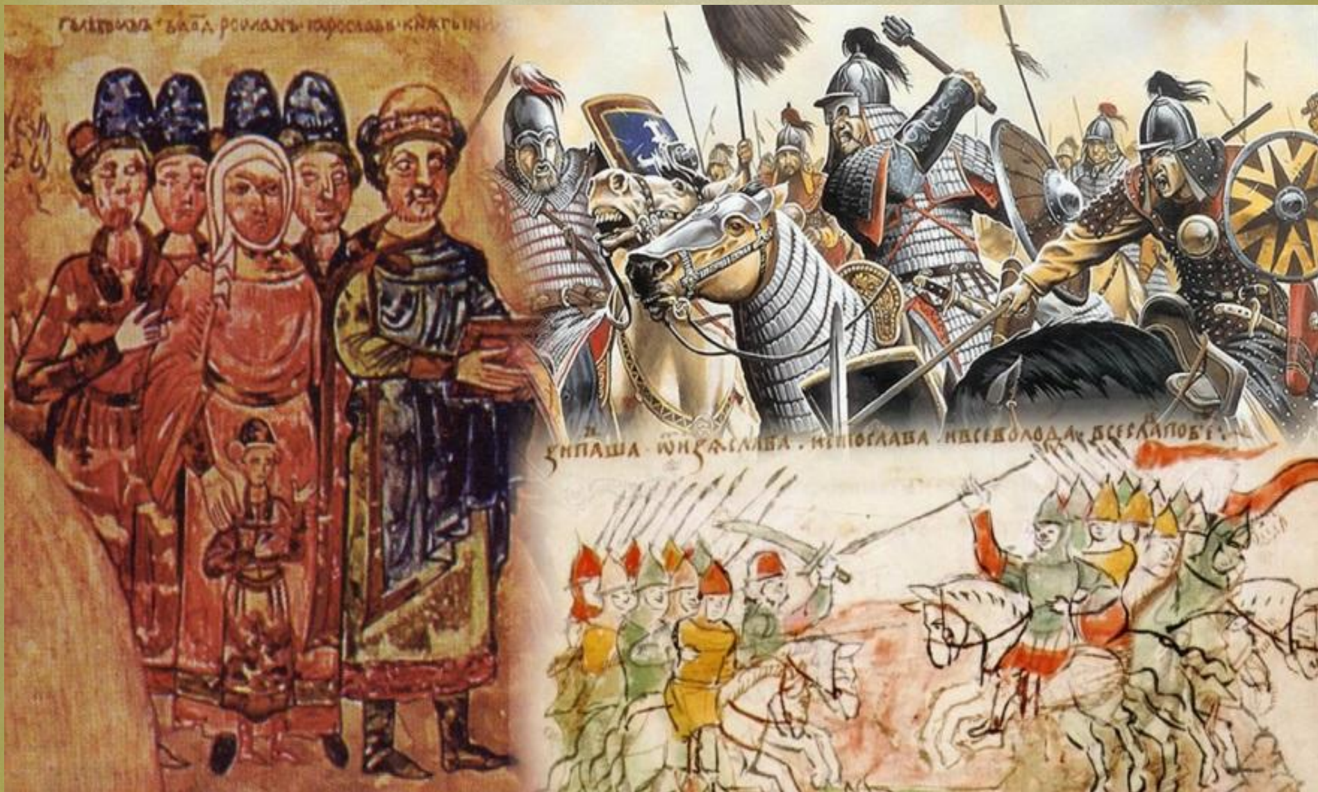
Виконав студент групи ПМ-15-1 Голуб Андрій