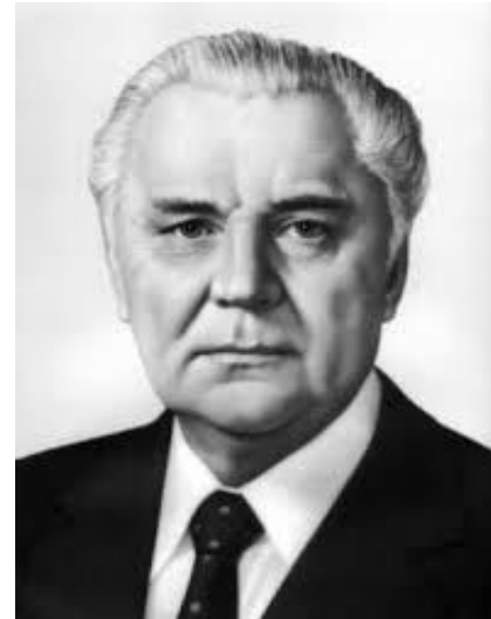
Володимир Щербицький 1972 – 1989 рр.

✓Що було спільного та відмінного в політиці П.Шелеста і В. Щербицького?