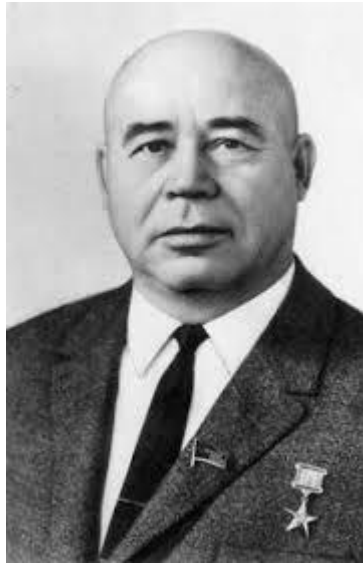
Петро Шелест 1963 – 1972 рр.