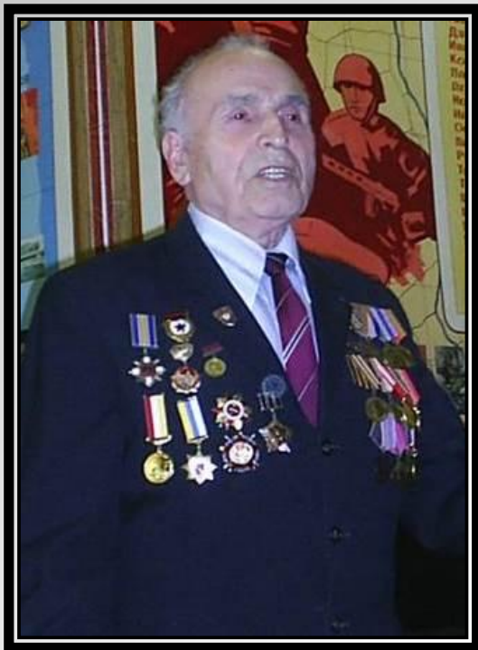
Киров Федор Зиновьевич ( 1925 )